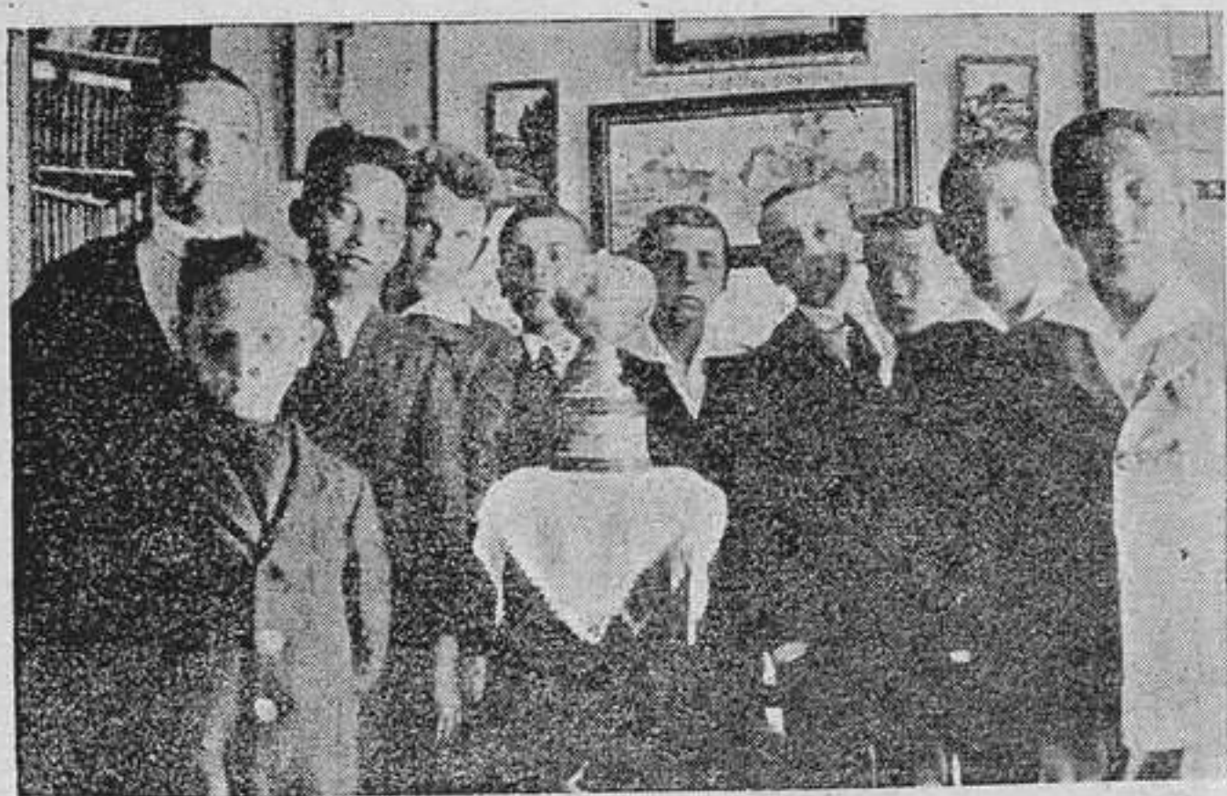
La junta directiva de la Mutualidad "Guillén de Castro" alrededor de la Hucha de honor.

lo presente a nuestros lectores. Su nombre es conocidísimo entre los Maestros españoles, y el prestigio de que goza es merecidísimo. Cuando en 1900 tomó posesión de esta Escuela, era una unitaria con 30 alumnos. Diez años después se graduó con cuatro secciones, que se elevaron a seis en 1917. A medida que el maestro conseguía estas victorias, fué apoderándose de los distintos pisos de la casa, hasta adueñarse de ella por completo. Hoy cuenta con una matrícula