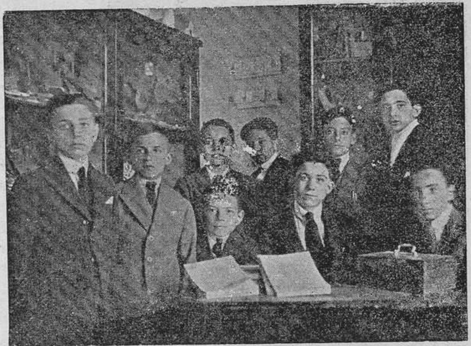
La Tí. ceta de la Mutualidad.

«Frecuentemente, se facilita a los niños