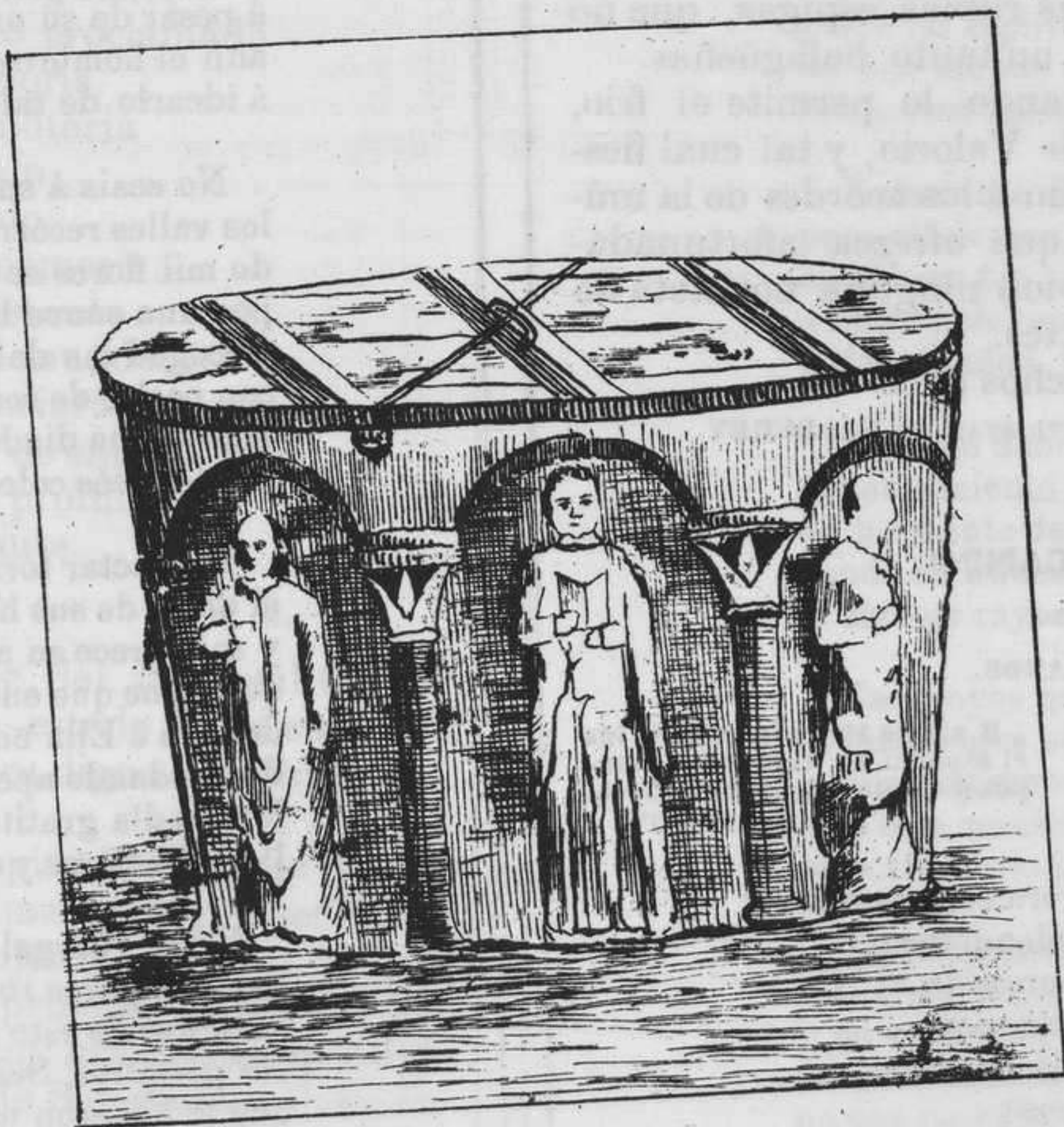
PILA BAUTISMAL DE LA IGLESIA DE SANTA MARIA LA NUEVA.

Figúrense ustedes que ahora han celebrado en París los señores inquilinos nada ménos que un congreso de gente de su misma habitabilidad con el piadoso objeto de que se mande rebajar el precio del alquiler de las casas, y para obtenerlo se han propuesto solu-