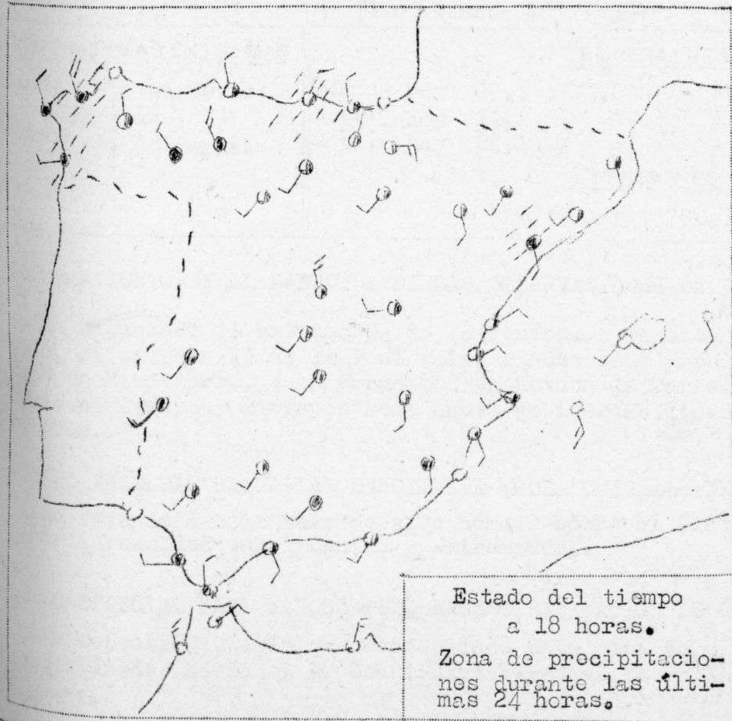
Estado del tiempo a 18 horas. Zona de precipitaciones durante las últimas 24 horas.