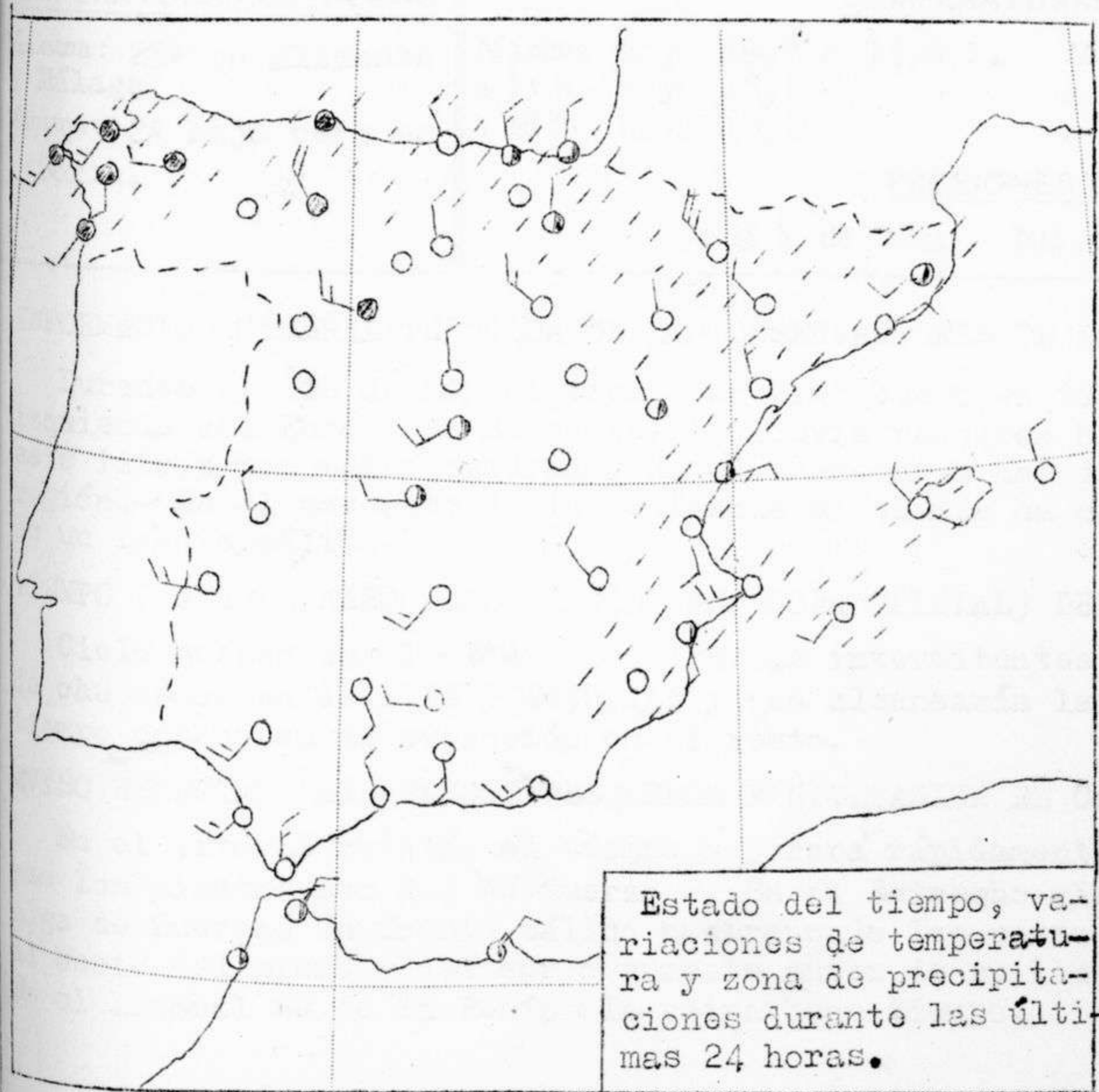
Estado del tiempo, variaciones de temperatura y zona de precipitaciones durante las últimas 24 horas.