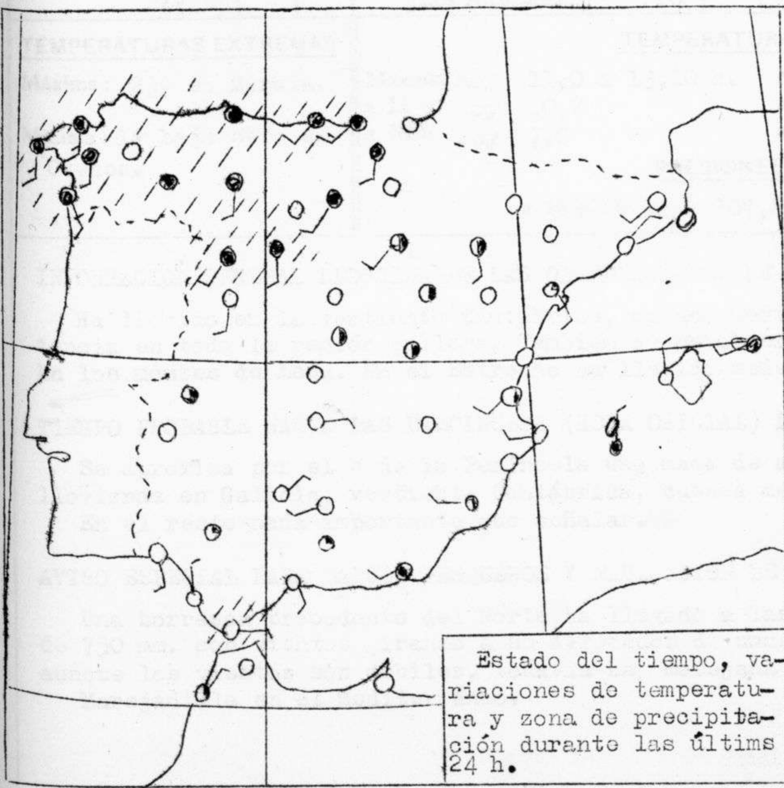
Estado del tiempo, variaciones de temperatura y zona de precipitación durante las últimas 24 h.