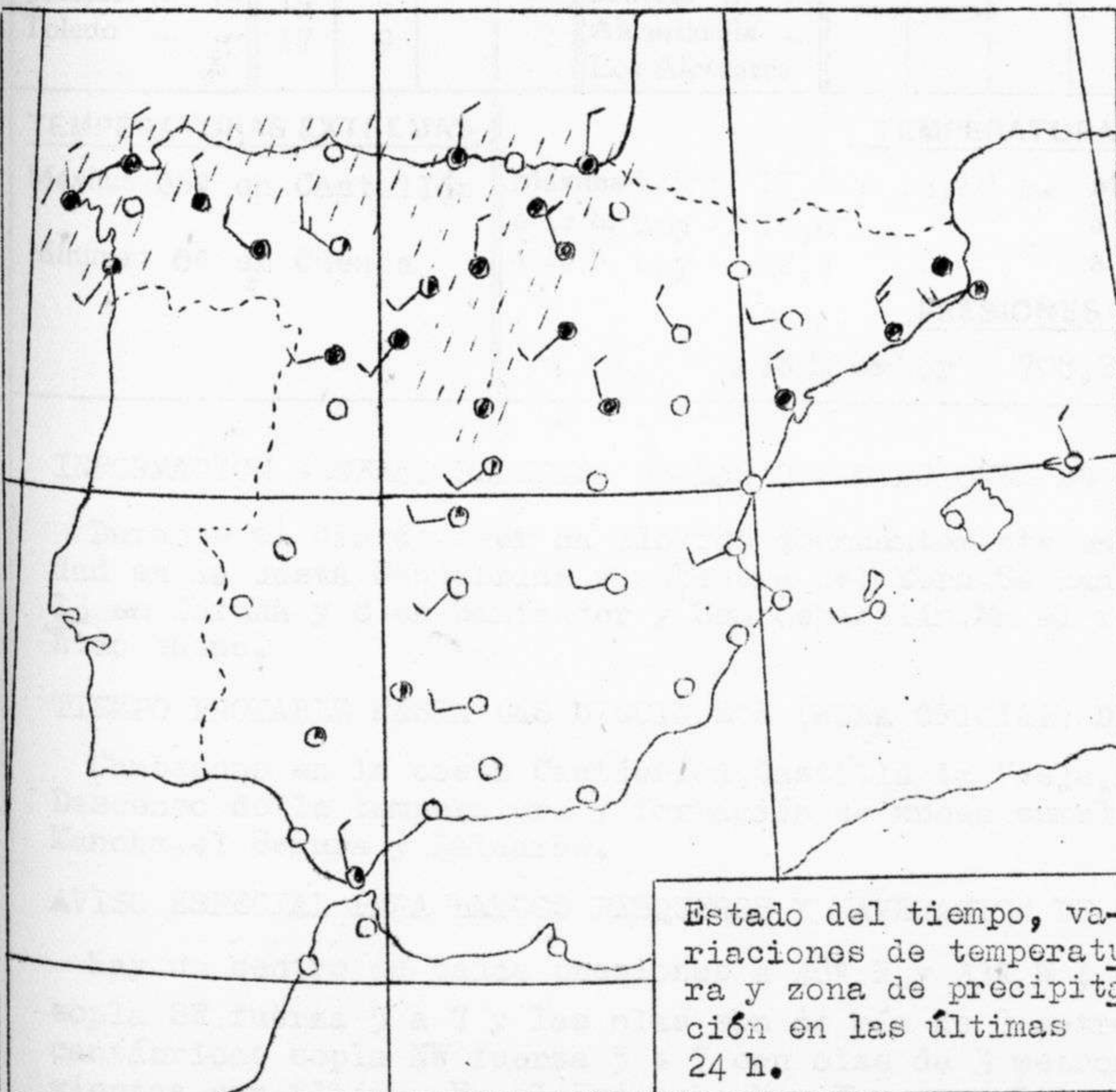
Estado del tiempo, variaciones de temperatura y zona de precipitación en las últimas 24 h.