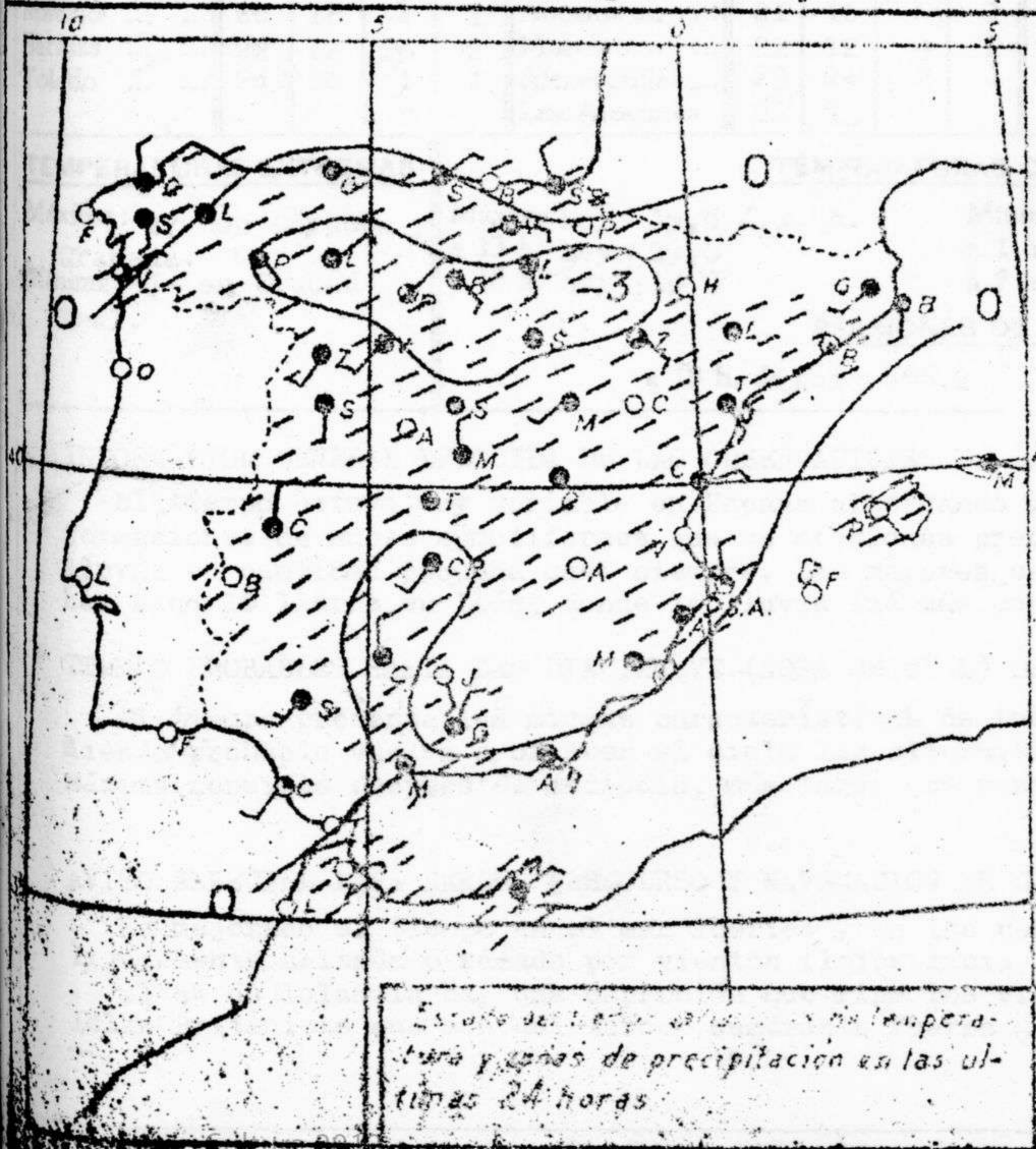
Estado del tiempo, viento, temperatura y zonas de precipitación en las últimas 24 horas