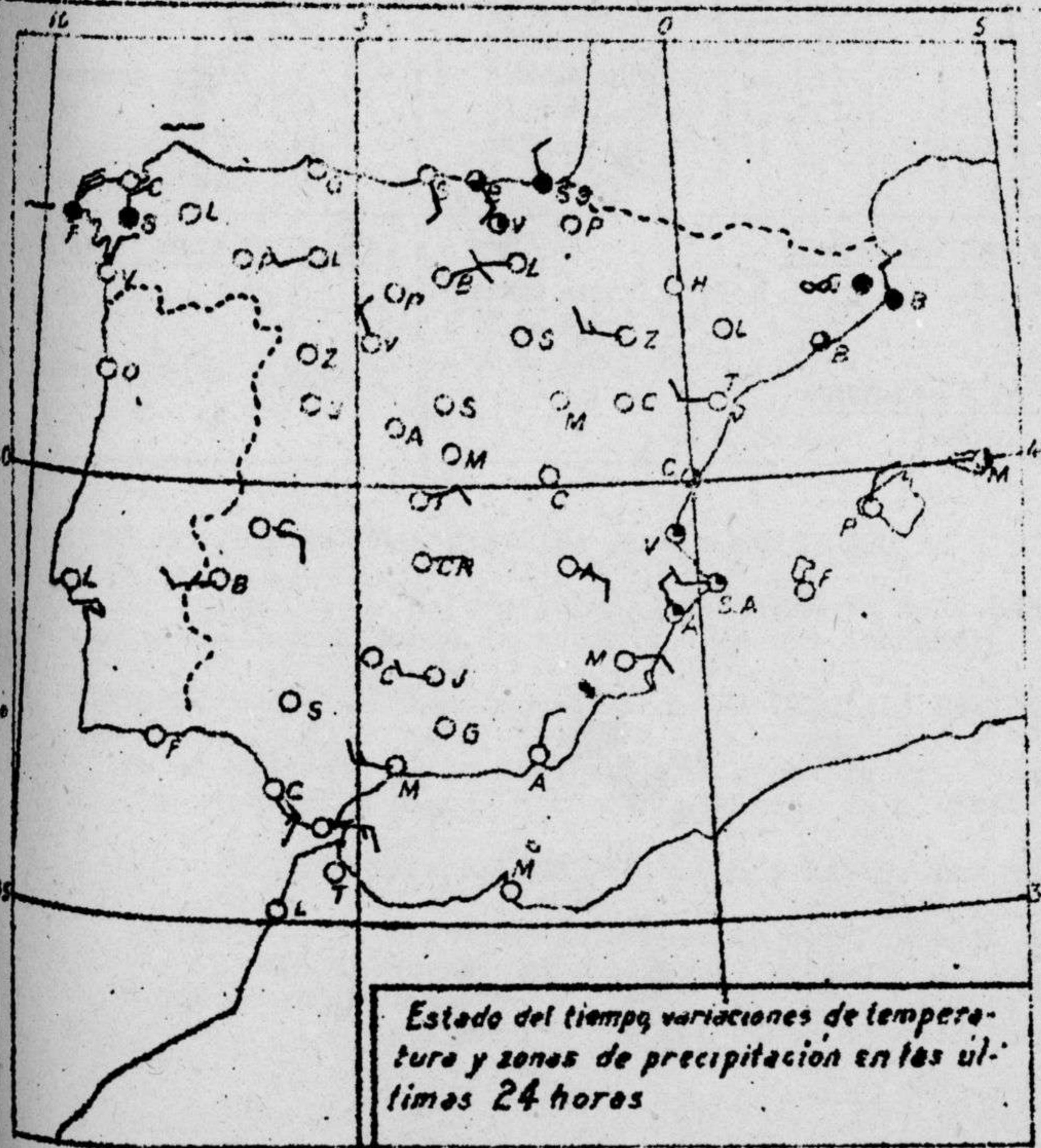
Estado del tiempo, variaciones de temperatura y zonas de precipitación en las últimas 24 horas