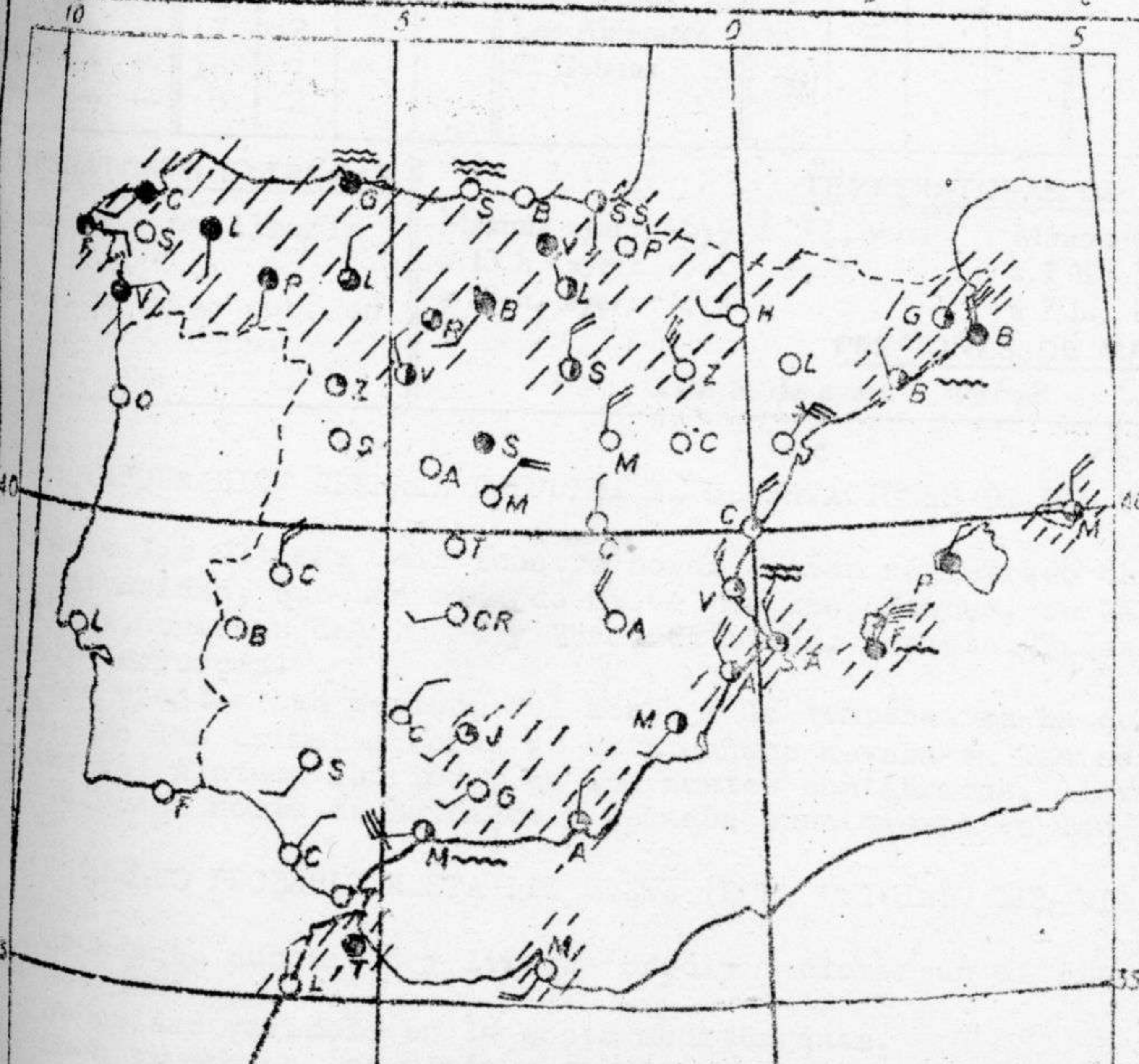
Estado del tiempo variaciones de temperatura y zonas de precipitación en las últimas 24 horas