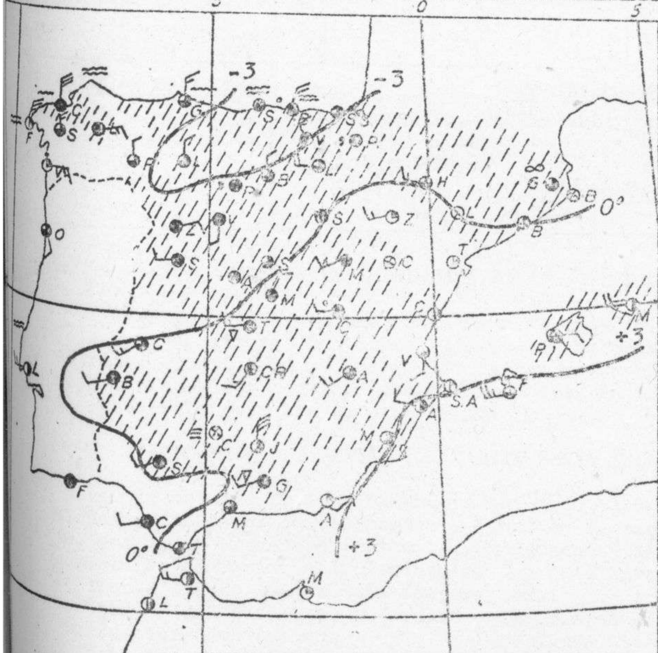
Estado del tiempo, variaciones de temperatura y zonas de precipitación en las últimas 24 horas