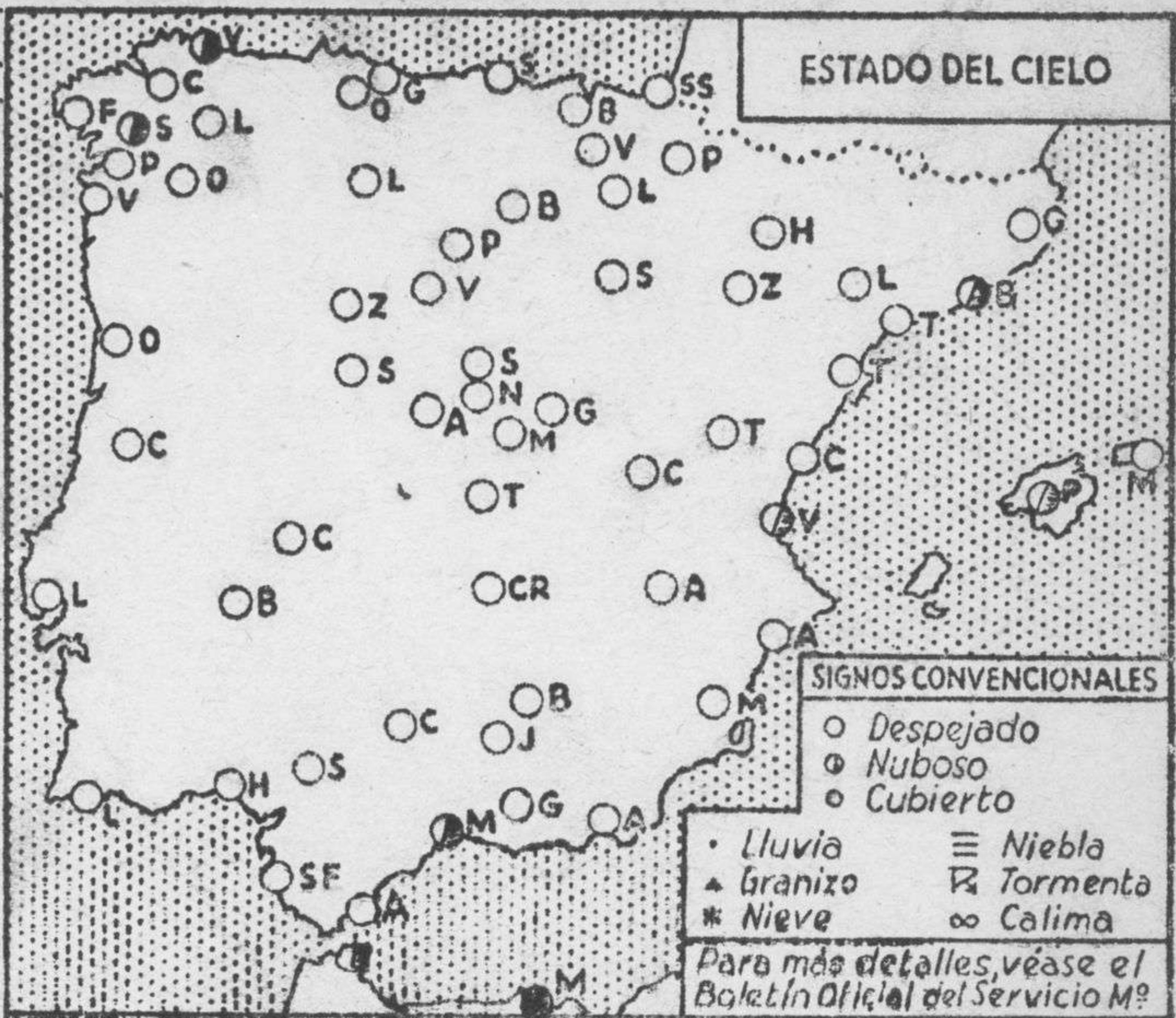
ESTADO DEL CIELO