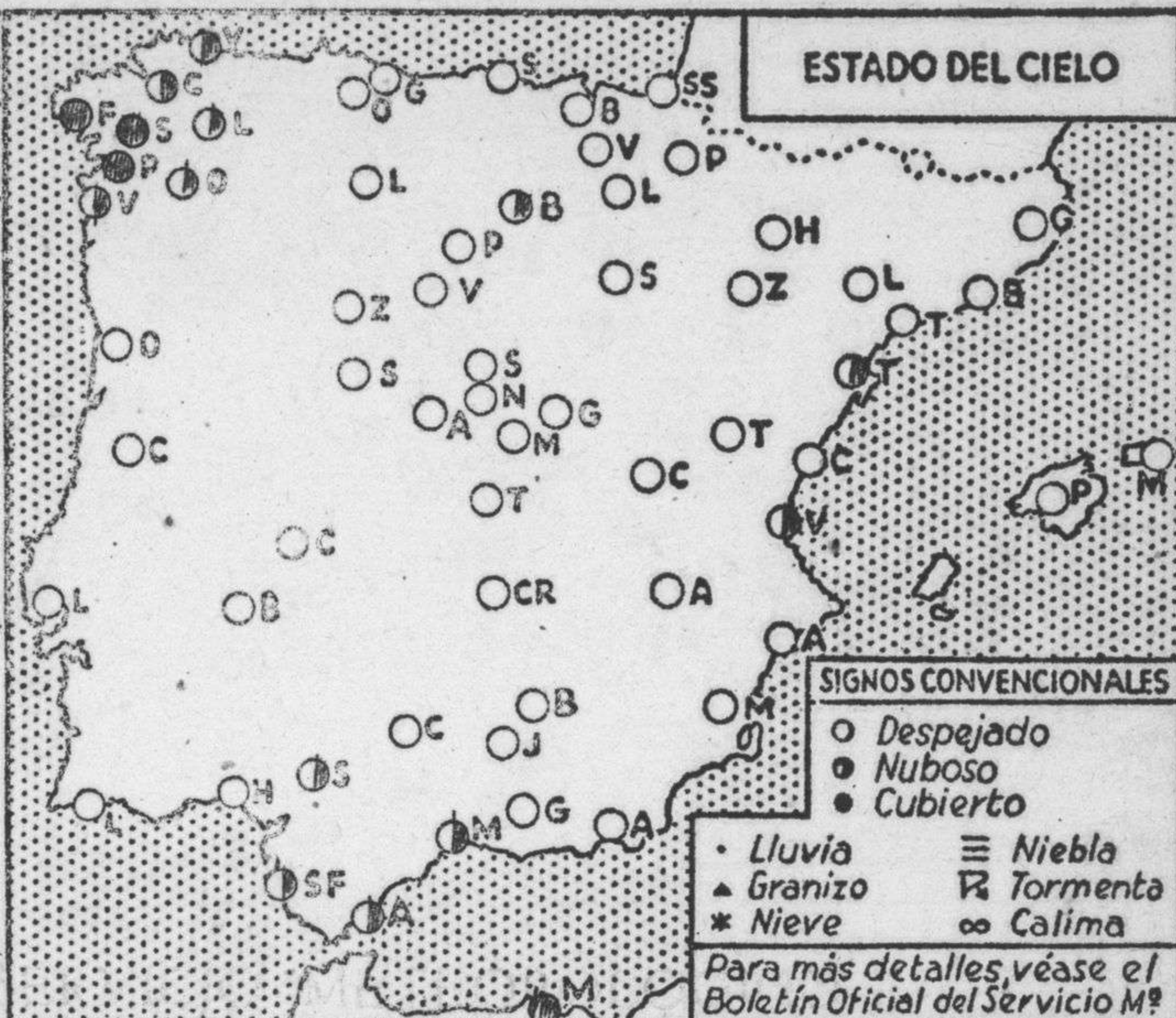
ESTADO DEL CIELO