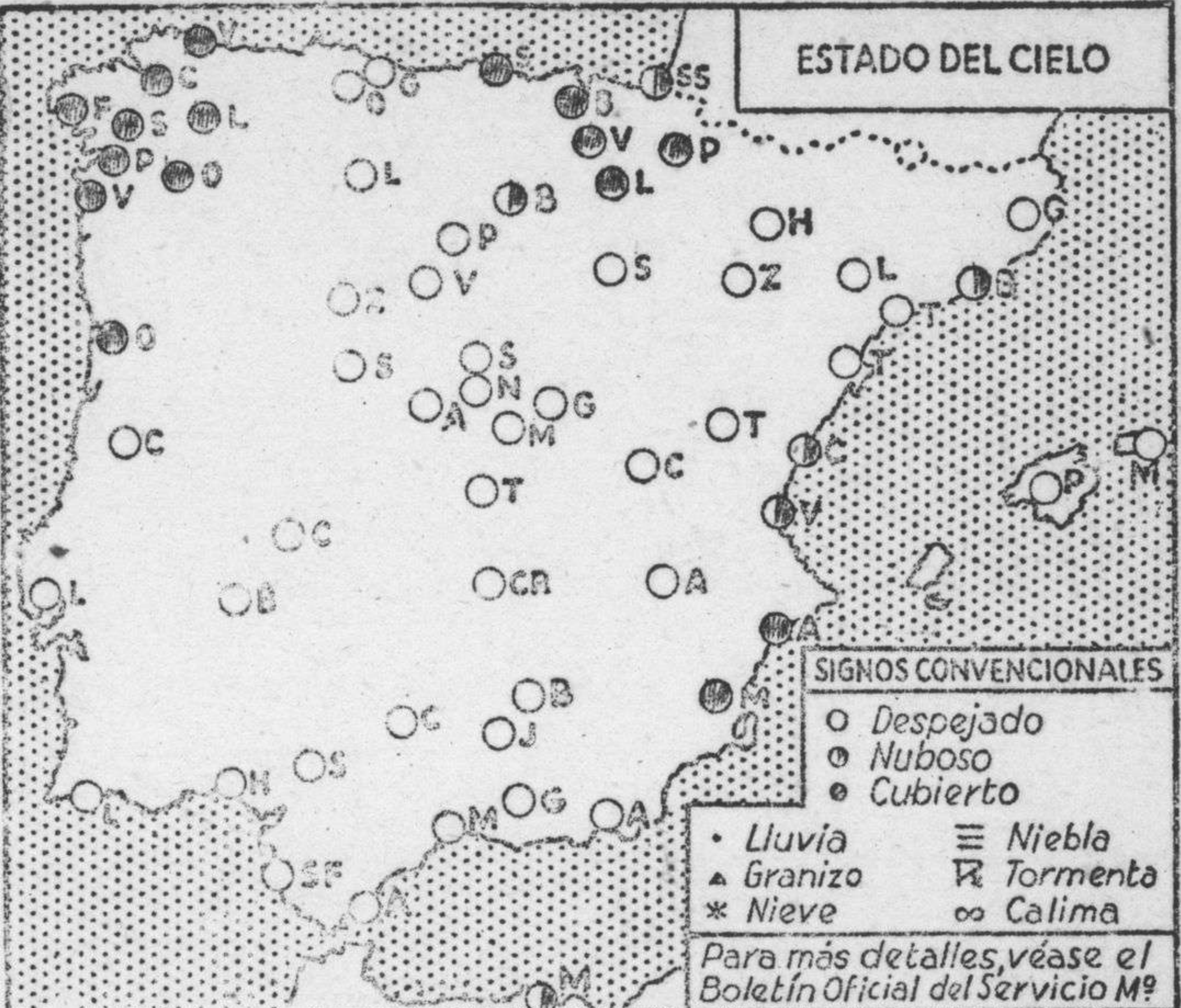
ESTADO DEL CIELO