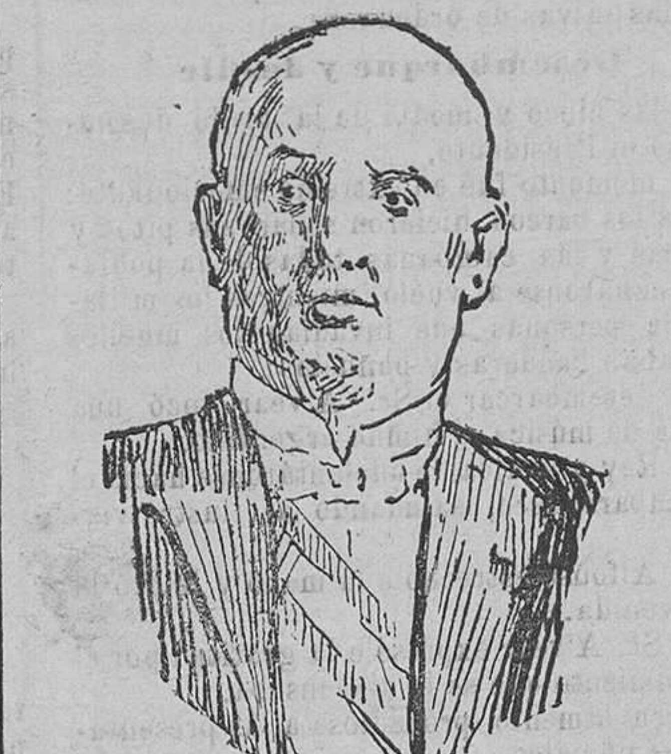
El nuevo Presidente electo de la República Argentina que se encuentra en España.