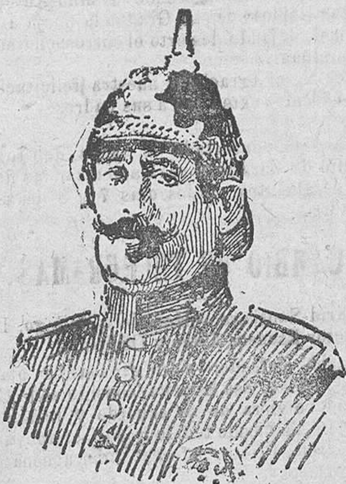
El general Burguete nuevo alto comisario de España en Africa.