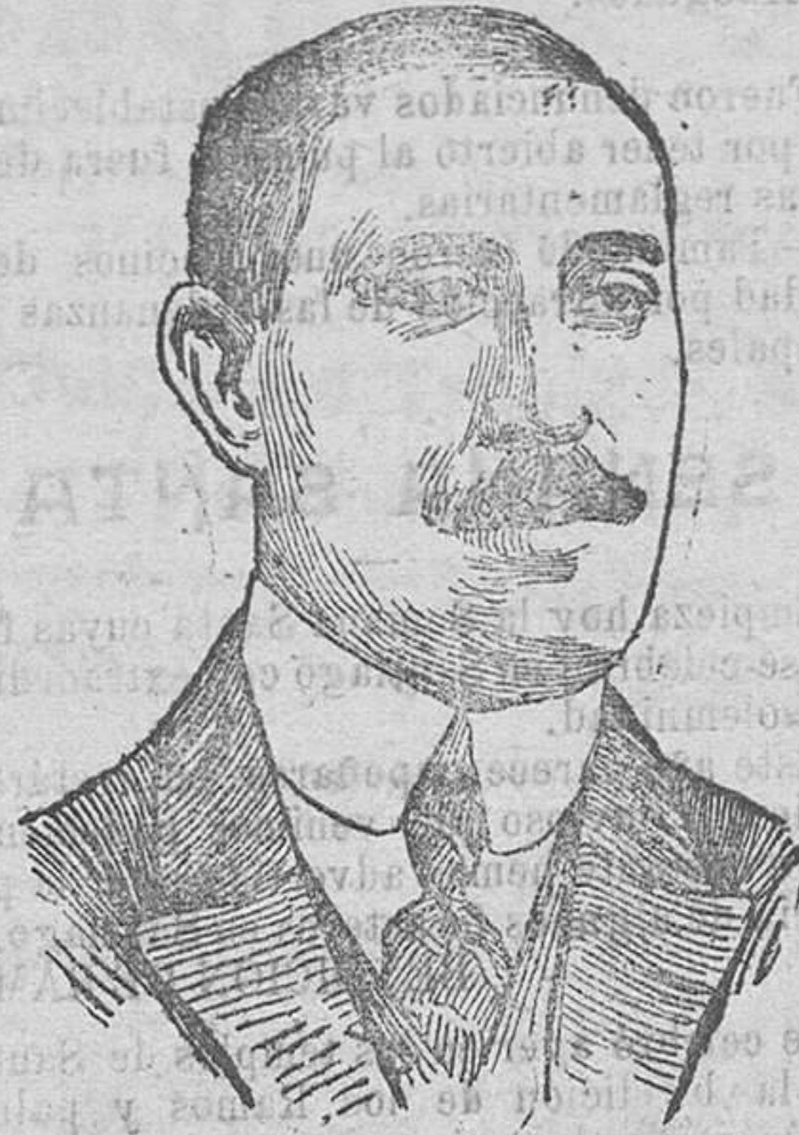
El ex-ministro D. Pablo Garnica que ha sido nombrado para representar al Gobierno español en la Conferencia de Génova.