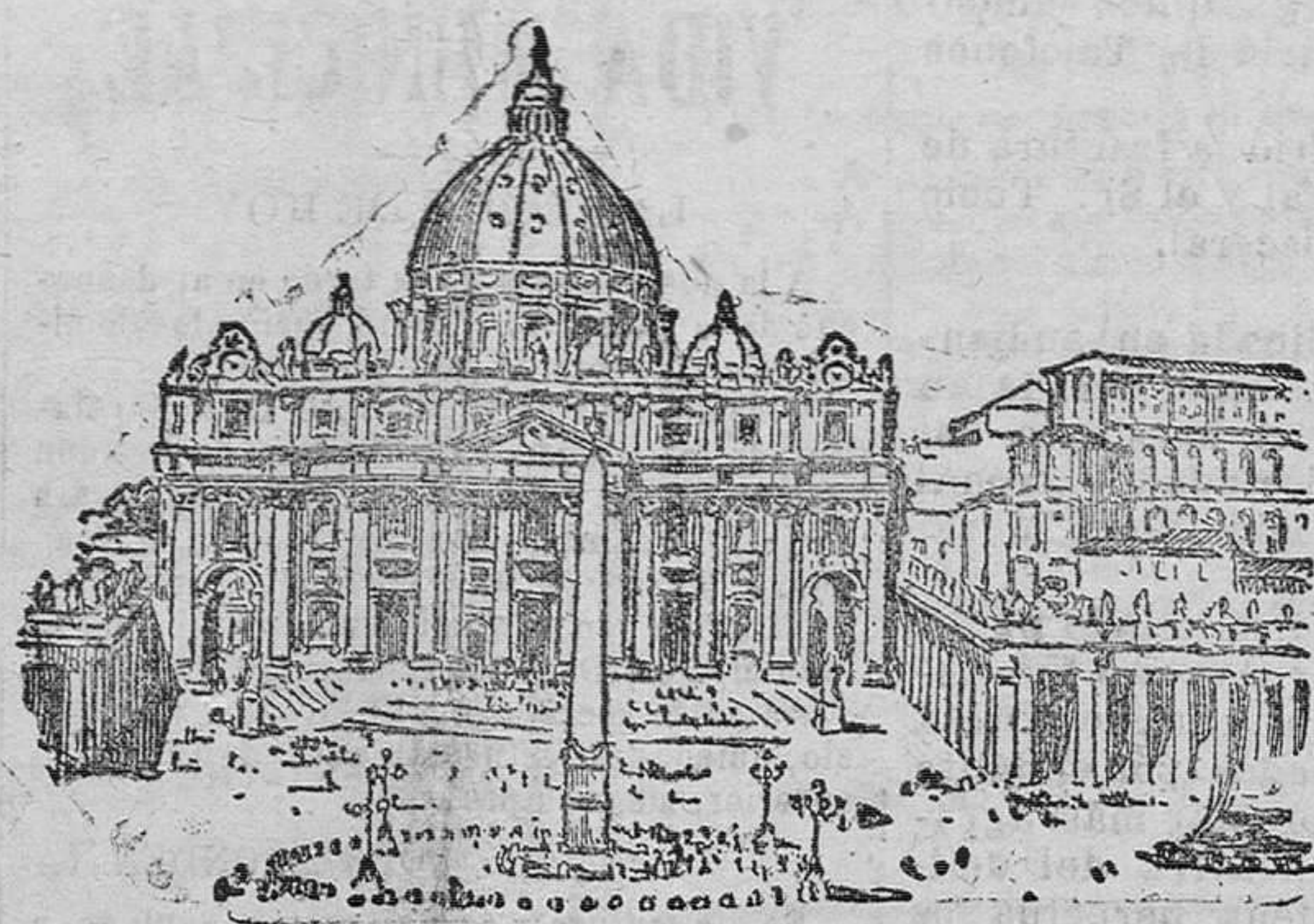
Basílica y plaza de San Pedro, en Roma, donde se levanta el Vaticano y donde hoy se habrá celebrado la solemne ceremonia de abrir la Puerta Santa.

El Niño, el «Bambino», duerme desnudo, color de rosa, reclinado en su rubio colchón de sedefa paja. En toda la Basílica no se escucha más ruido que el chisporroteo suave de los cirios y el murmullo de la oración que el Papa empieza a elevar.—A las primeras palabras, anímase el Niño con vida fantástica: la escultura se hace carne. Sus ojos se entreabren sus pupilas se tienden hacia el Papa, como se tendería hacia un abuelo cariñoso, haciendo fiestas. Incorporado y sentado en la paja, llama al Pontífice que sigue orando, pero que cree percibir en sus redillas la sensación de que ya no reposan en los cojines de terciopelo carmesí, en sus codos algo que les sube y aparta del esculpido reclinatorio. Ligero y como fluido, su cuerpo no le pesa; flota apaciblemente en una atmósfera de oro y luz, hecha de las partículas de los cirios que se derraman ardientes y centelleantes.—La cuna ha desaparecido el Niño está de pie, alto, crecido ya, convertido en adolescente; y en vez de la gracia infantil, en su cara se lee la meditación, se descubre la sombra del pensamiento. Alrededor de