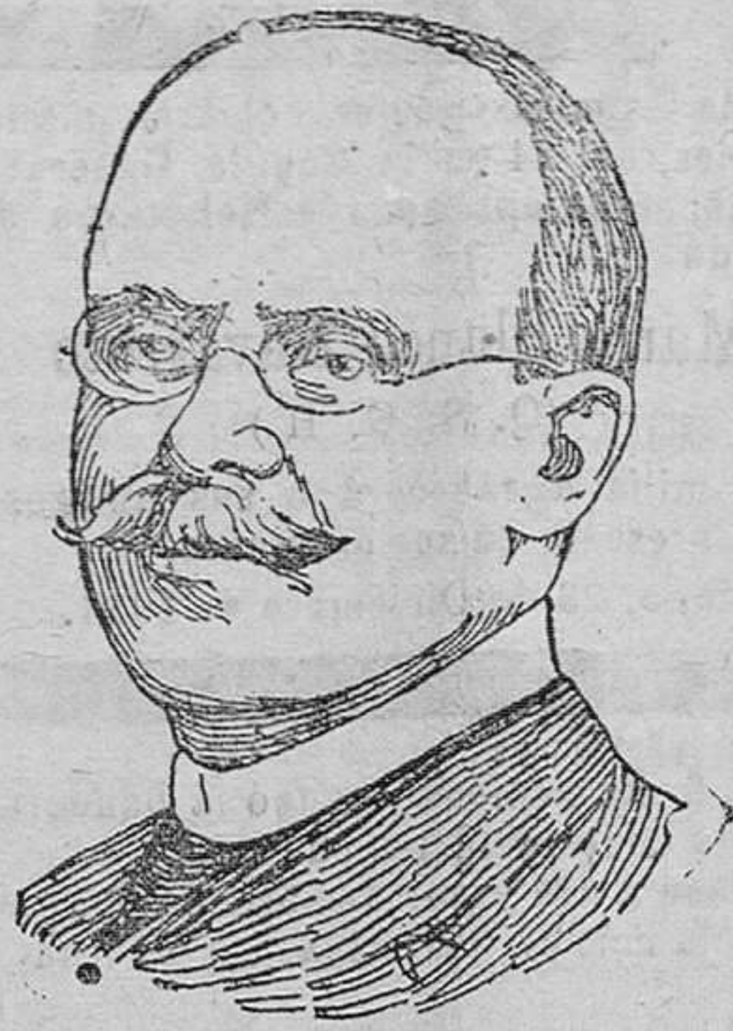
Von Marx, canceller del Reich, que ha presentado la dimisión del Gobierno.

el acuerdo del Gobierno, insultando de paso a Salmerón y a Sanz del Río.