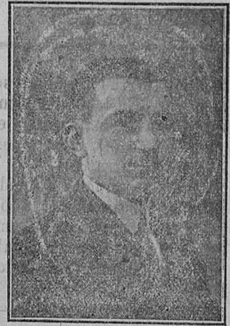
D. Angel Herrera, Director de «El Debate» y propagandista católico que hoy pronunciará un discurso en el Salón Teatro.