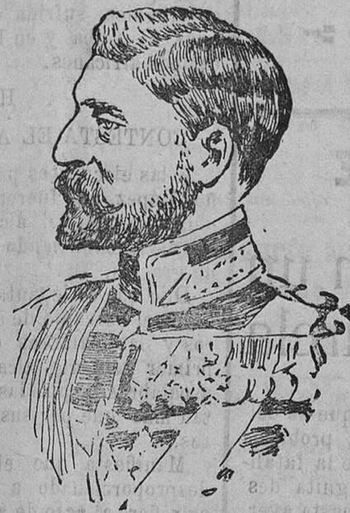
El Rey Fernando de Rumania que se encuentra gravemente enfermo.