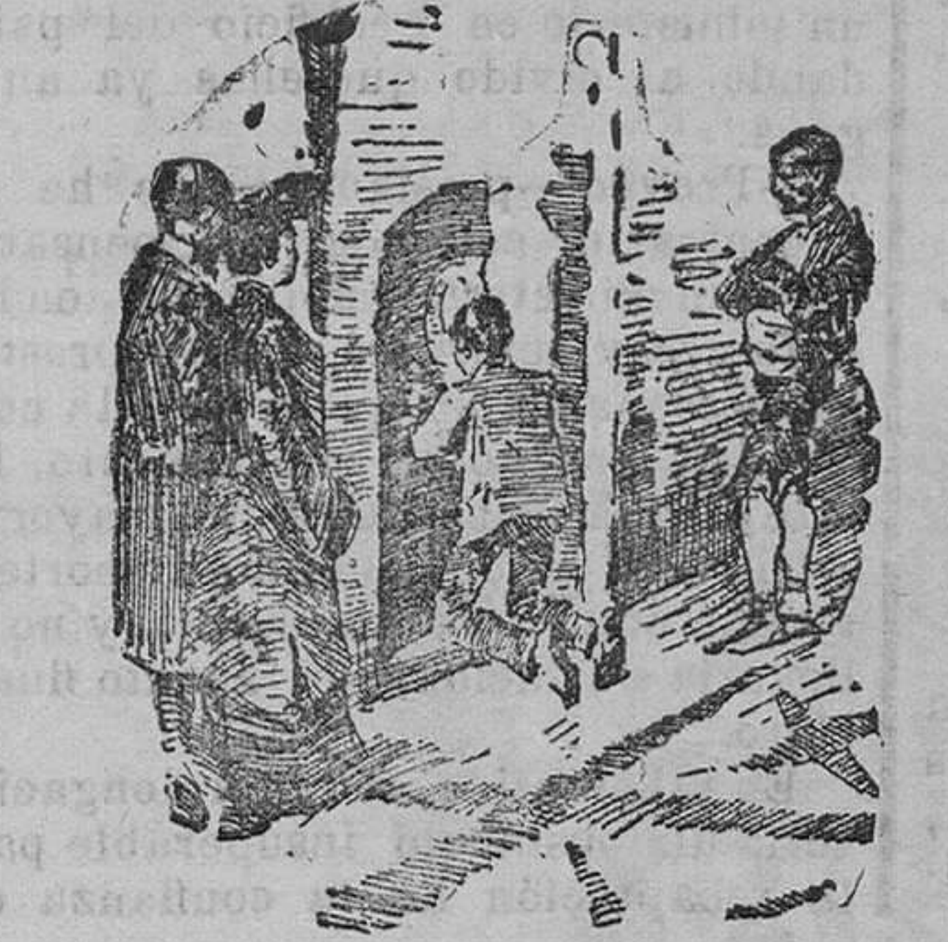
Peregrinos adorando el Pilar