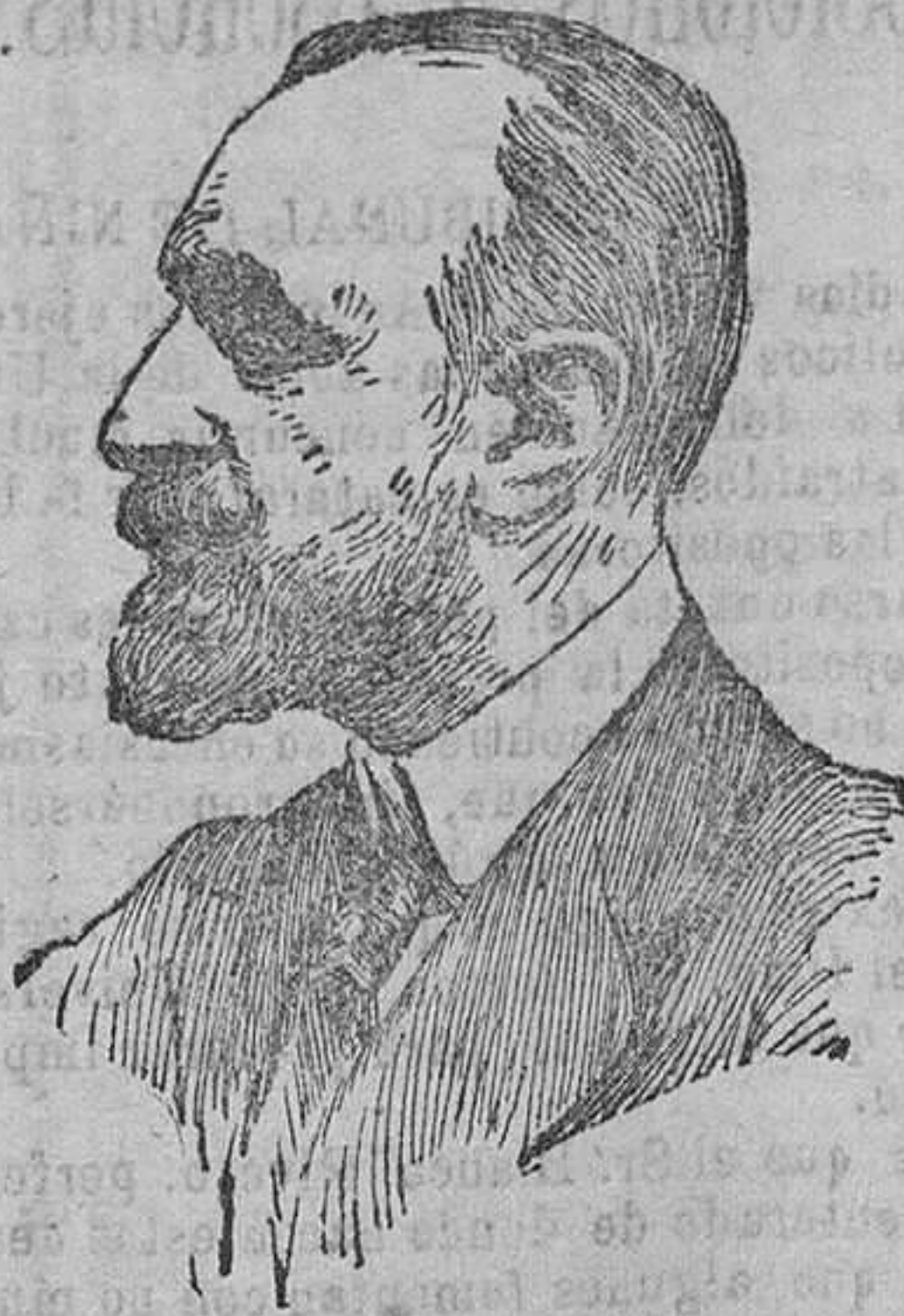
El gran explorador francés Juan Charco que ha sido elegido miembro de la Academia de Ciencias de París.

donde reposan los restos de los conquistadores de Granada; pero el Monarca aclaró sus propósitos diciéndoles socarronamente al mismo tiempo que cogía la colilla de un puro que había dejado sobre el guardabarros del coche al abandonarlo.