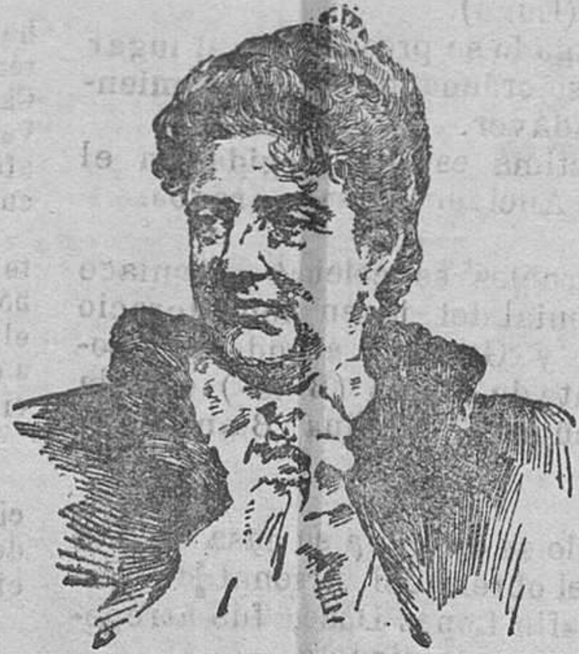
La reina Margarita de Saboya madre del rey Victor Manuel de Italia que se halla gravemente enferma en su castillo de Bordighiere.

ningún número. Tiene un dato más positivo. Entre las participaciones que se ha visto obligado a aceptar, para que sus amigos ofrendes no sue- fen con la totalidad de los premios, solamente le falta una terminación: la del 8.