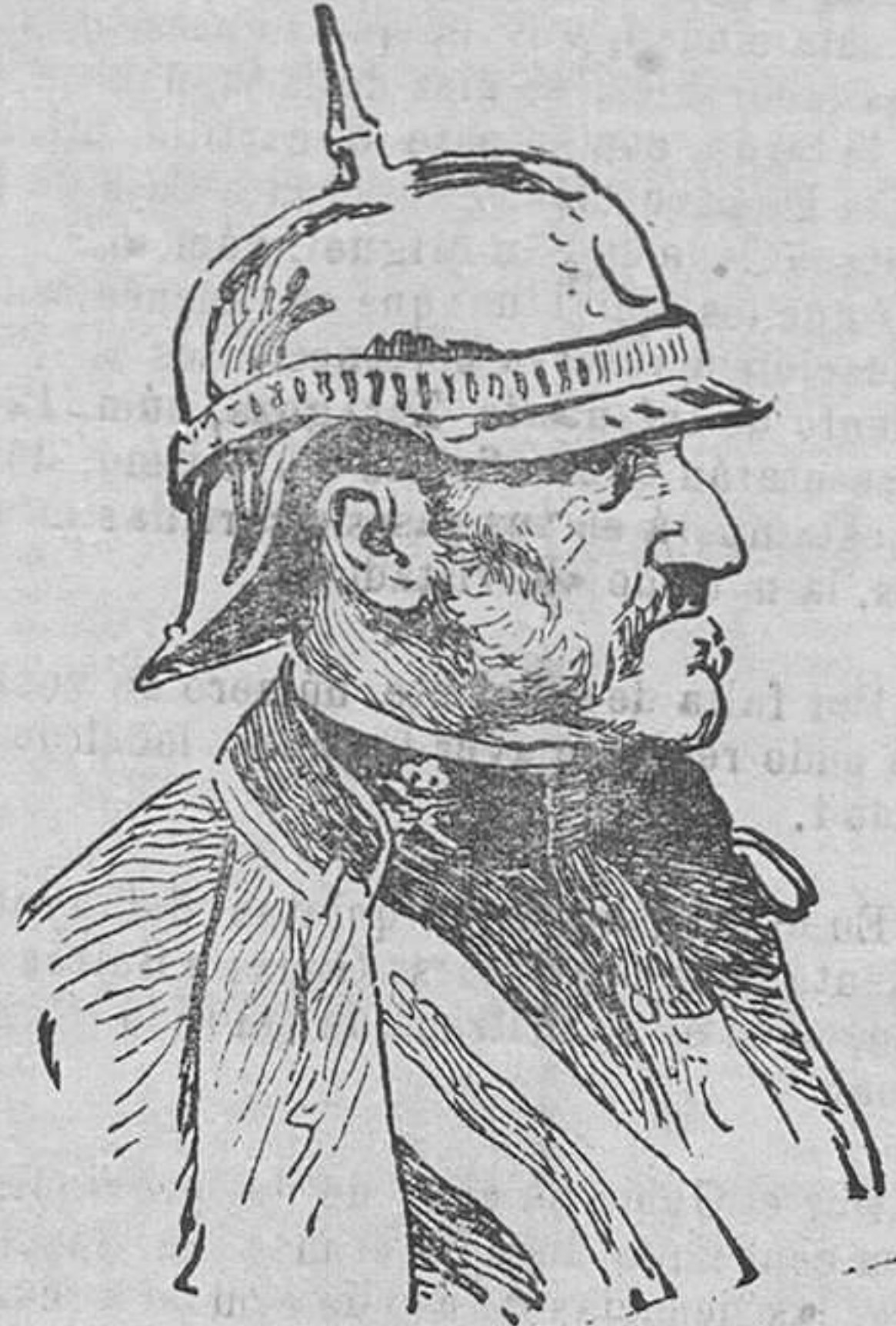
Excmo. Sr. D. Valeriano Weyler, duque de Rubi, que ha cesado en el cargo de jefe de Estado Mayor Central.

bo palabras gruesas y algunas bofetadas.