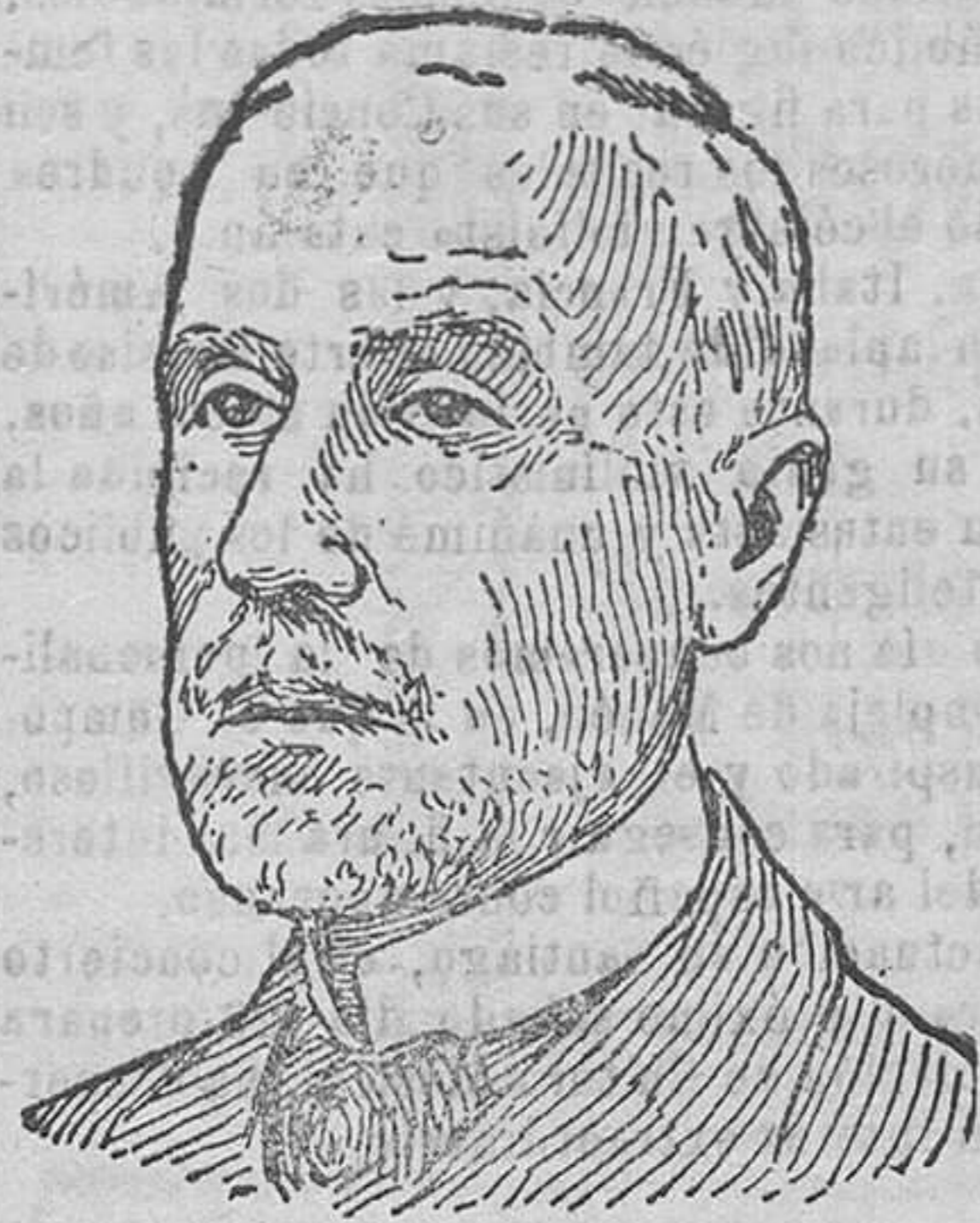
El presidente de la República Portuguesa Don Manuel Teixeira Gomes, que para reponer su quebrantada salud se ha trasladado a los montes de Alcandra.