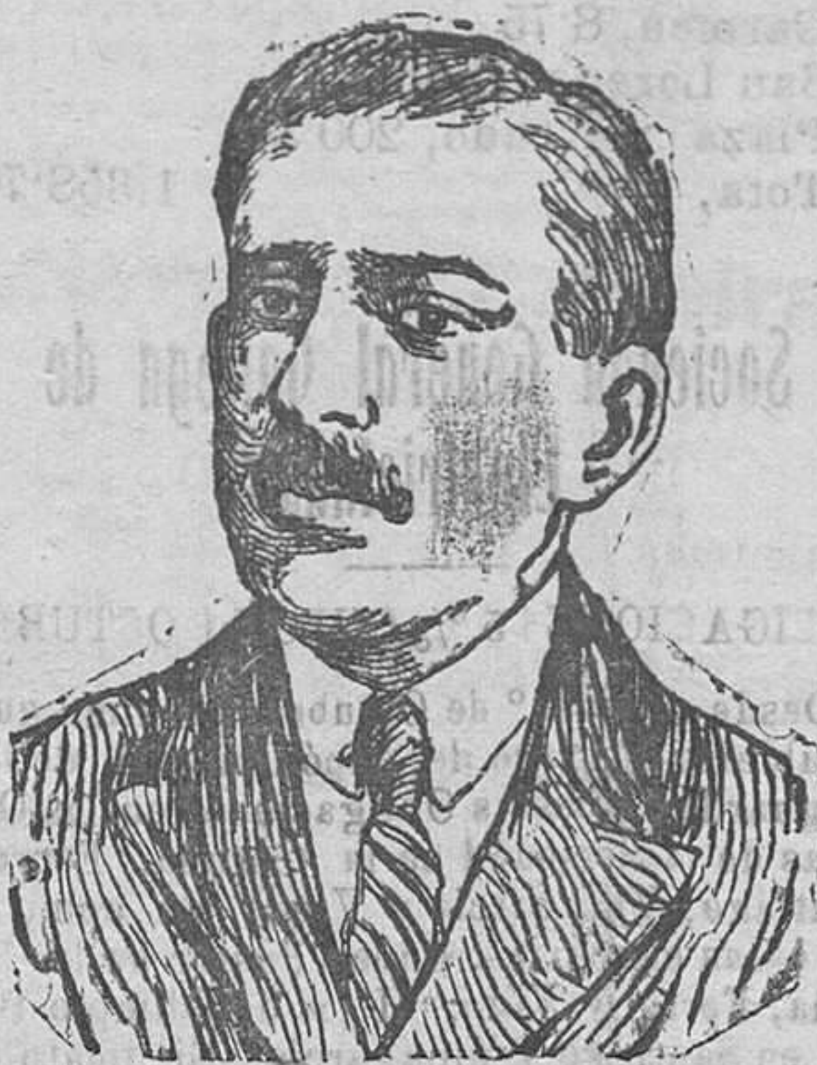
El famoso capitán nacionalista Ekrart que fué sumariado con motivo del golpe de von Kapp, y que ha sido puesto en libertad por un auto de «no ha lugar», que beneficia a todos los inculpados.

dice su padre a Ventura—, no hay para tu travesura otro remedio, a mi ver.