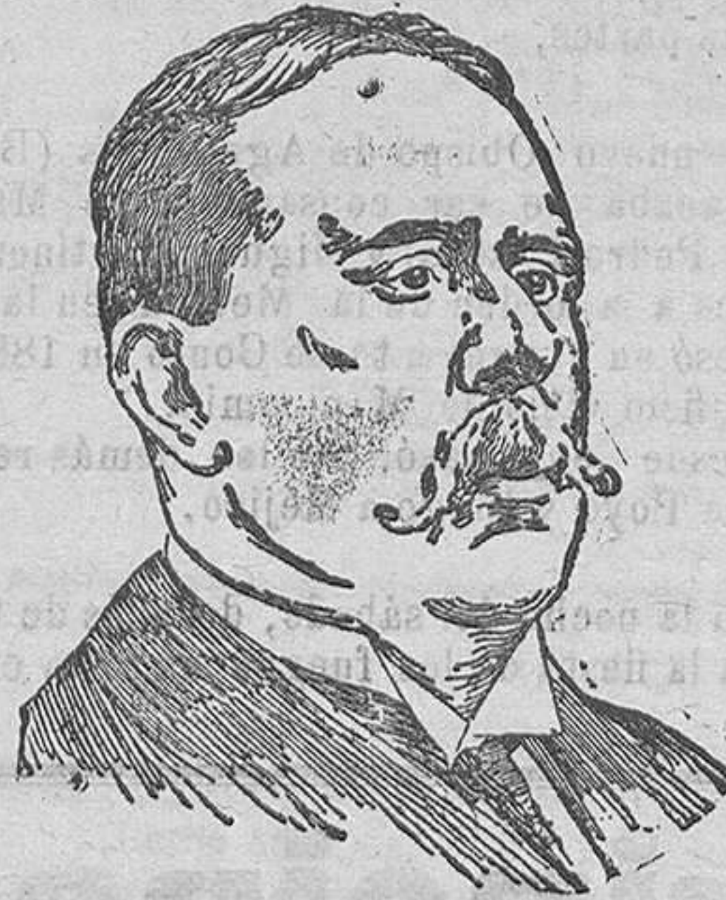
El distinguido literato Narciso Díaz de Escobar a quien Milaga acaba de tributar un homenaje como premio a sus trabajos en favor de las escuelas.