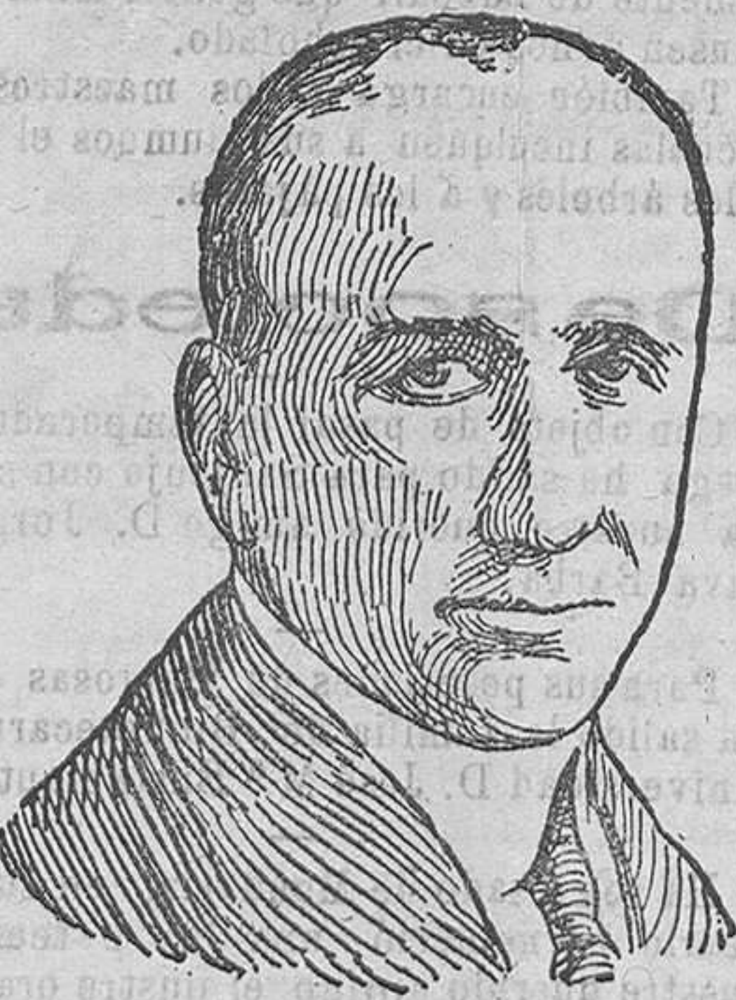
D. Francisco Largo Caballero, representante del socialismo español en la Conferencia de Ginebra.

y con las pestañas rechazan la alimentación que se les ofrece.