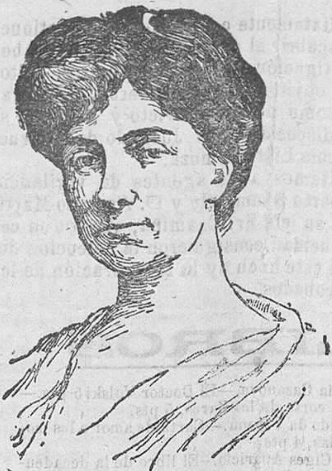
Sofía Casanova, la ilustre gallega que mañana hablará en la Universidad de la guerra y sus consecuencias.

contra el orden público y la seguridad personal tan en quiebra al «advenir el Directorio, y los propósitos que animan a éste de ir sucesivamente restableciendo las garantías constitucionales y las libertades públicas a que es tan acreedor el país por su cultura y sensatez, deciden al Directorio a proponer a Su Majestad el levantamiento del estado de guerra en toda España como muestra de la recíproca confianza entre gobernantes y gobernados.