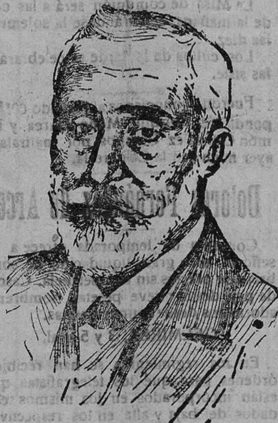
D. Antonio Maura, Presidente