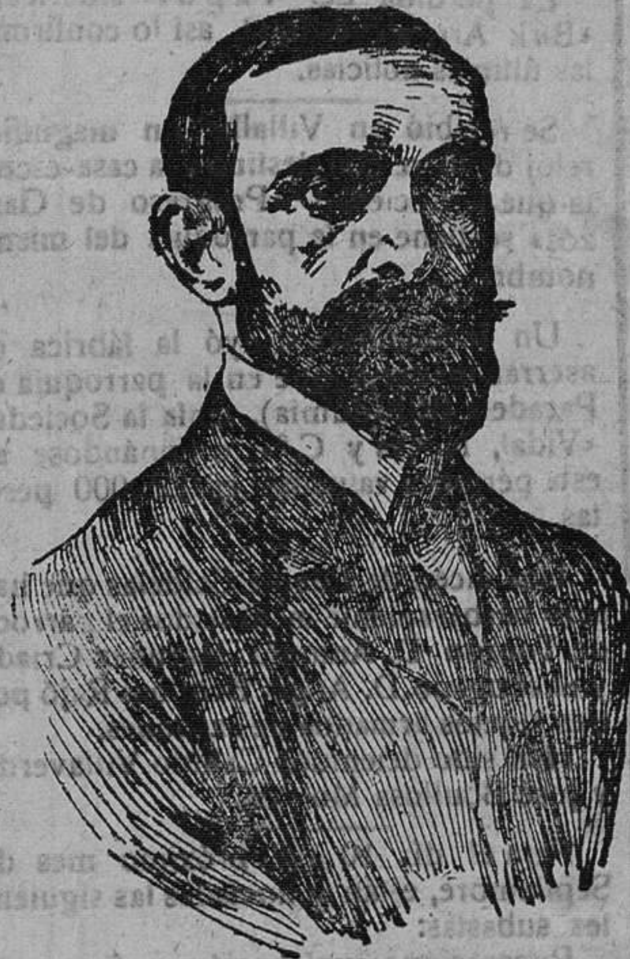
D. Francisco Cambó, Ministro de Hacienda