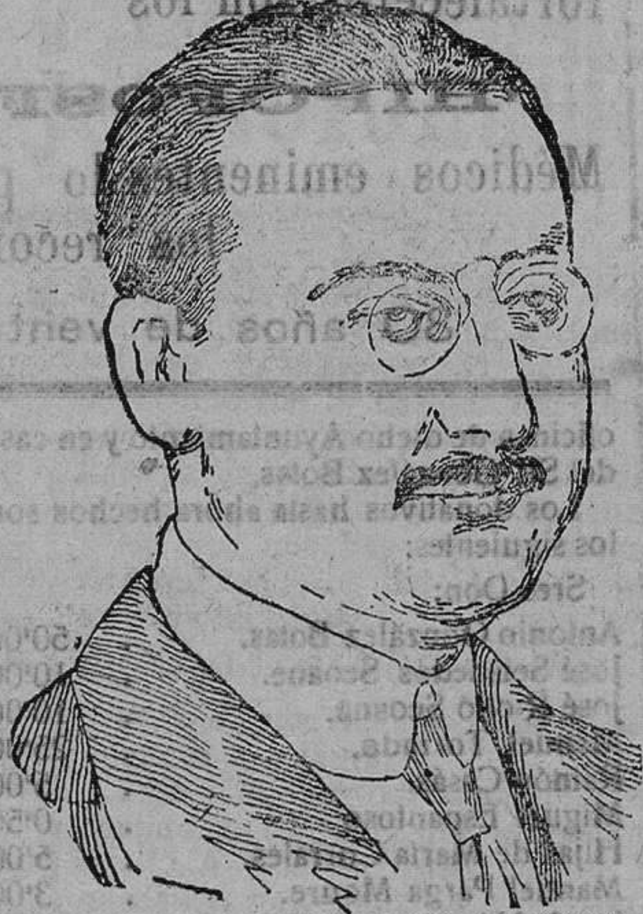
González Hontoria, Ministro de Estado