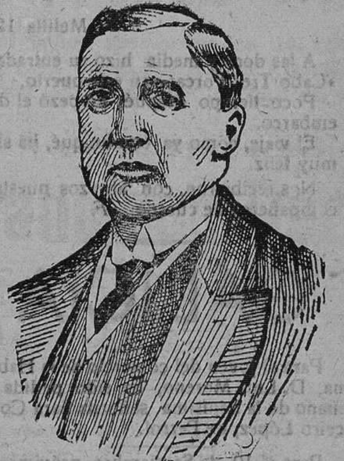
Marqués de la Cortina, Ministro de Marina