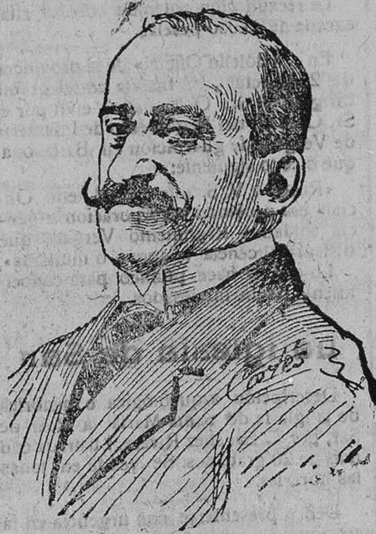
El conde de Romanones de quien se dijo que había sido objeto de un atentado en París, noticia afortunadamente inexacta.