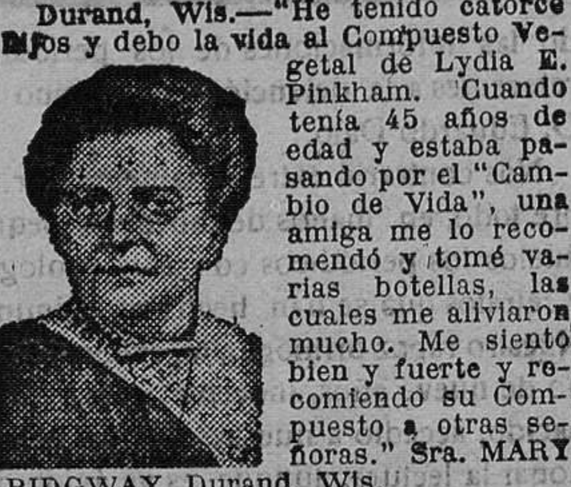
RIDGWAY, Durand, Wis. Una mujer de Massachusetts escribe lo siguiente:

Cuentan cómo se les ayudó pasar la edad crítica