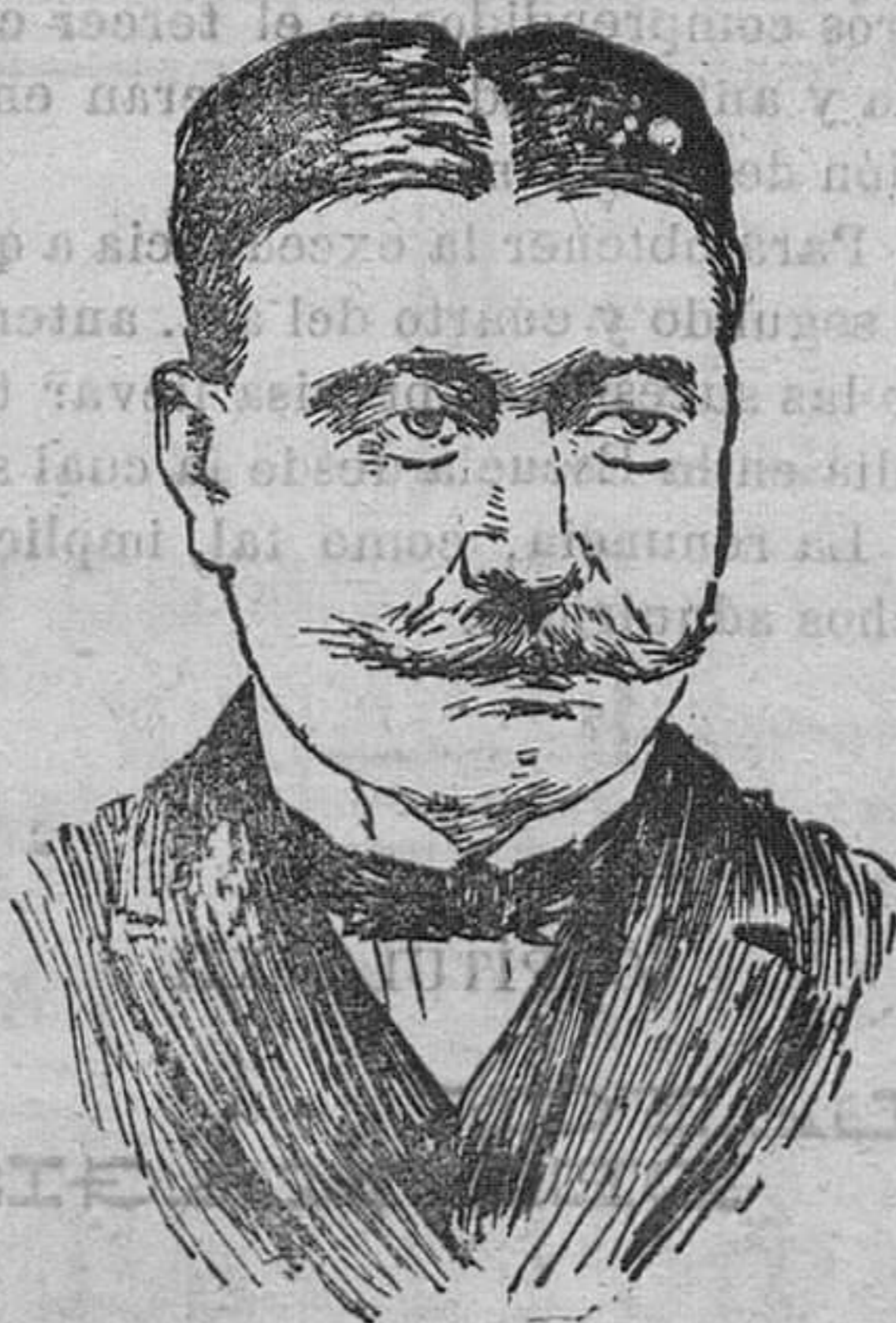
El exconsul de España en Tucumán, que va a la Argentina para instruir expediente sobre irregularidad y, que se dice, cometidas por el Consulado español en aquella república americana.