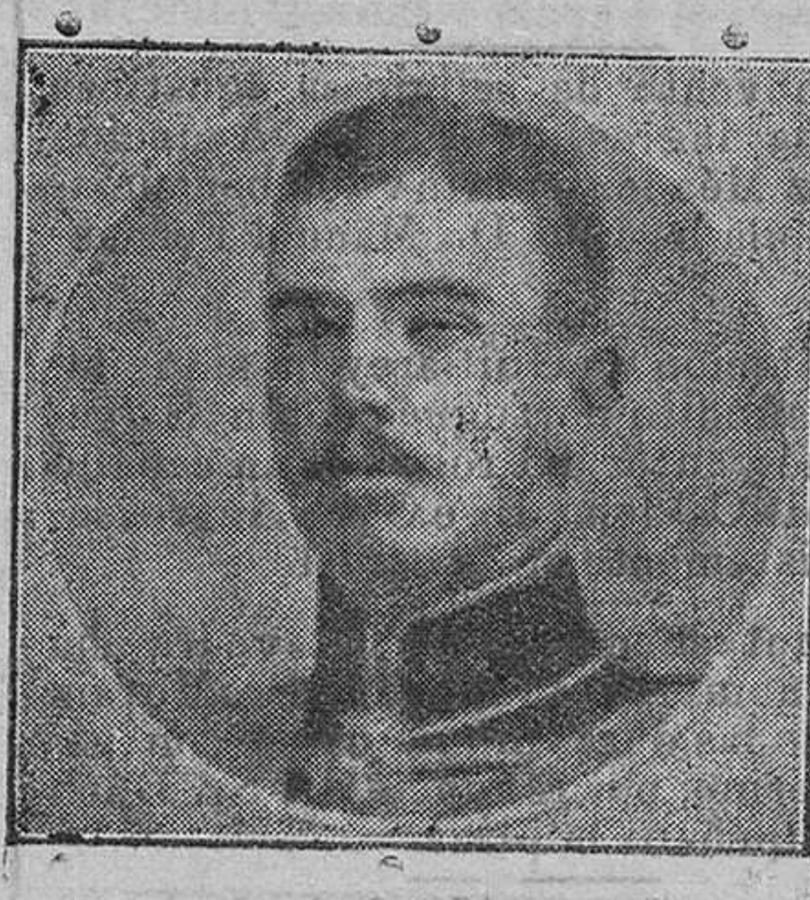
El príncipe heredero de Servia Alejandro Jandro, que asumió el mando supremo del ejército de su país en la guerra contra Austria.