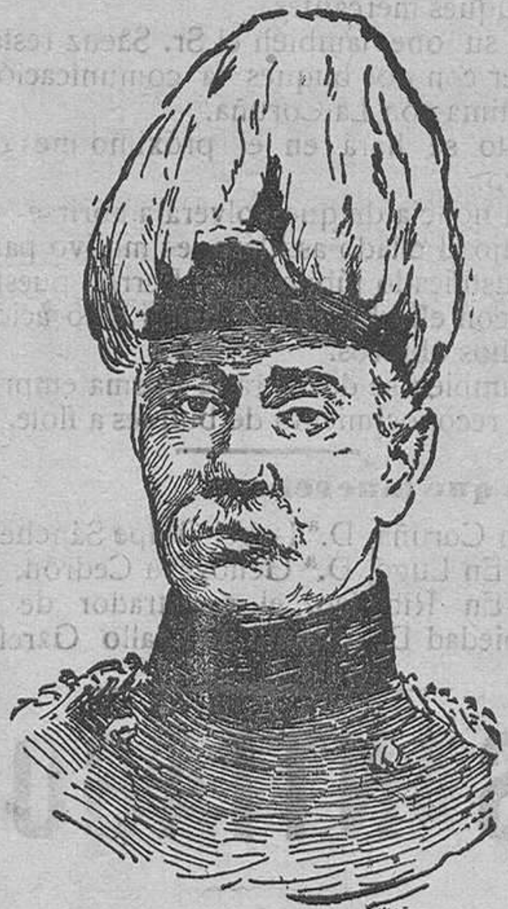
General sir Horacio Plumer, nombrado comandante en jefe del ejército inglés en el frente italiano