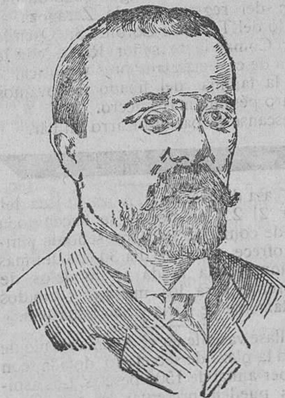
Mr. Barthon, nuevo ministro de Negocios extranjeros de Francia.