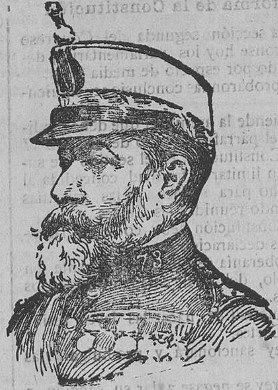
El teniente general D. José Marina, nombrado ayer ministro de la Guerra en sustitución del señor Marqués de Estella.