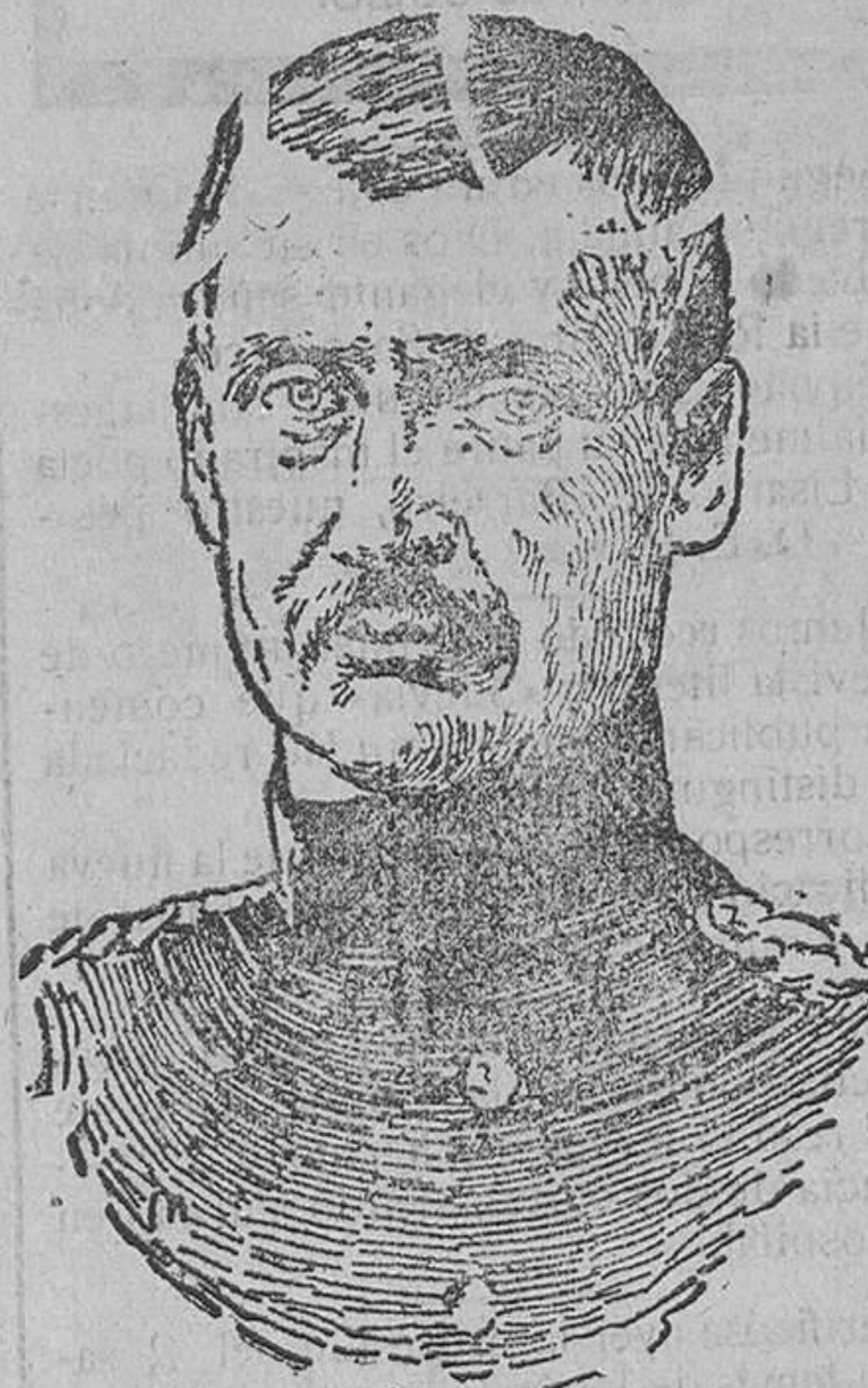
Príncipe Rupprecht, comandante del ejército alemán que actualmente está realizando una importante reacción en el frente de Iprés.