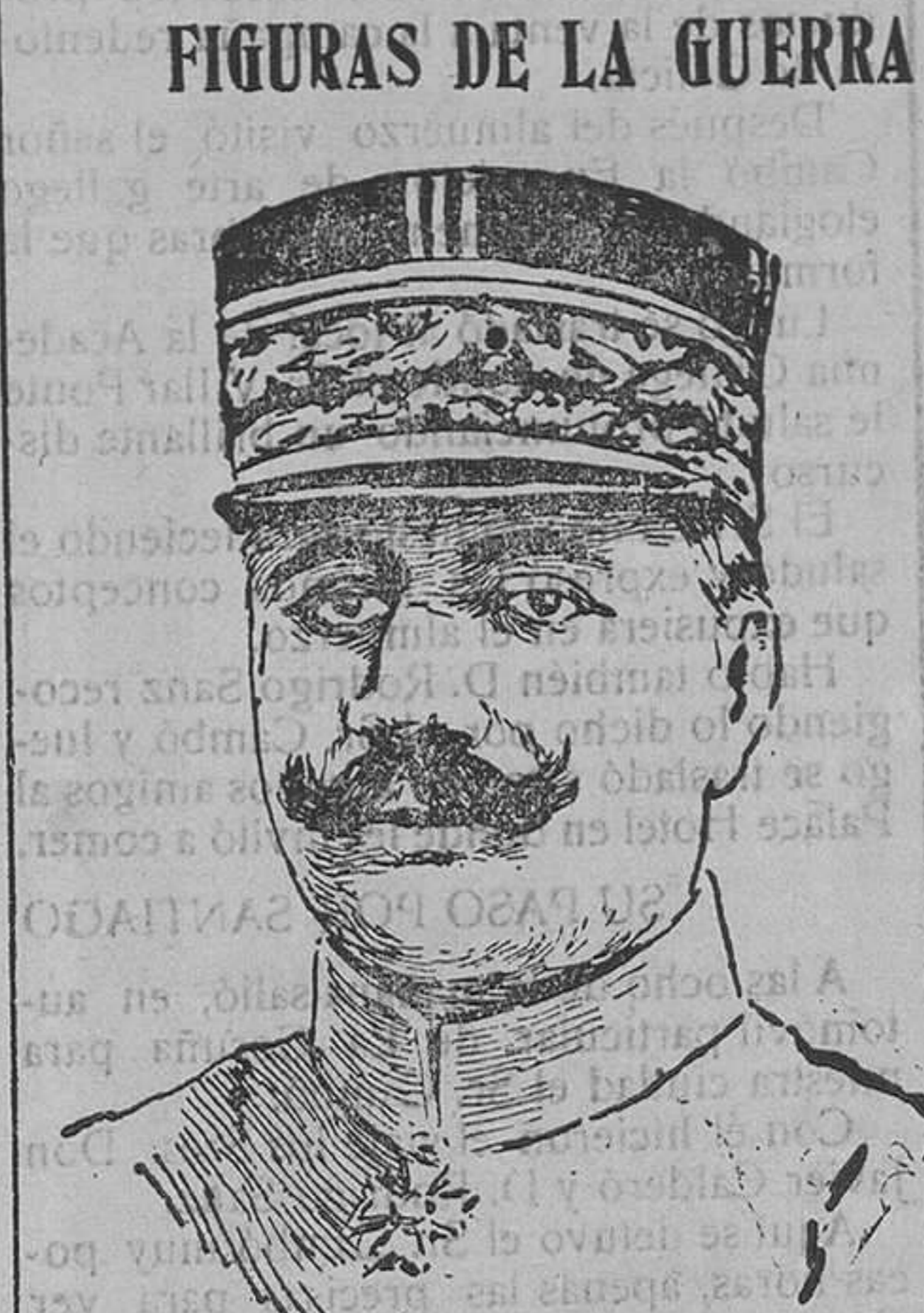
General Gillaumat, comandante del ejército francés que se apoderó de la cota 304.