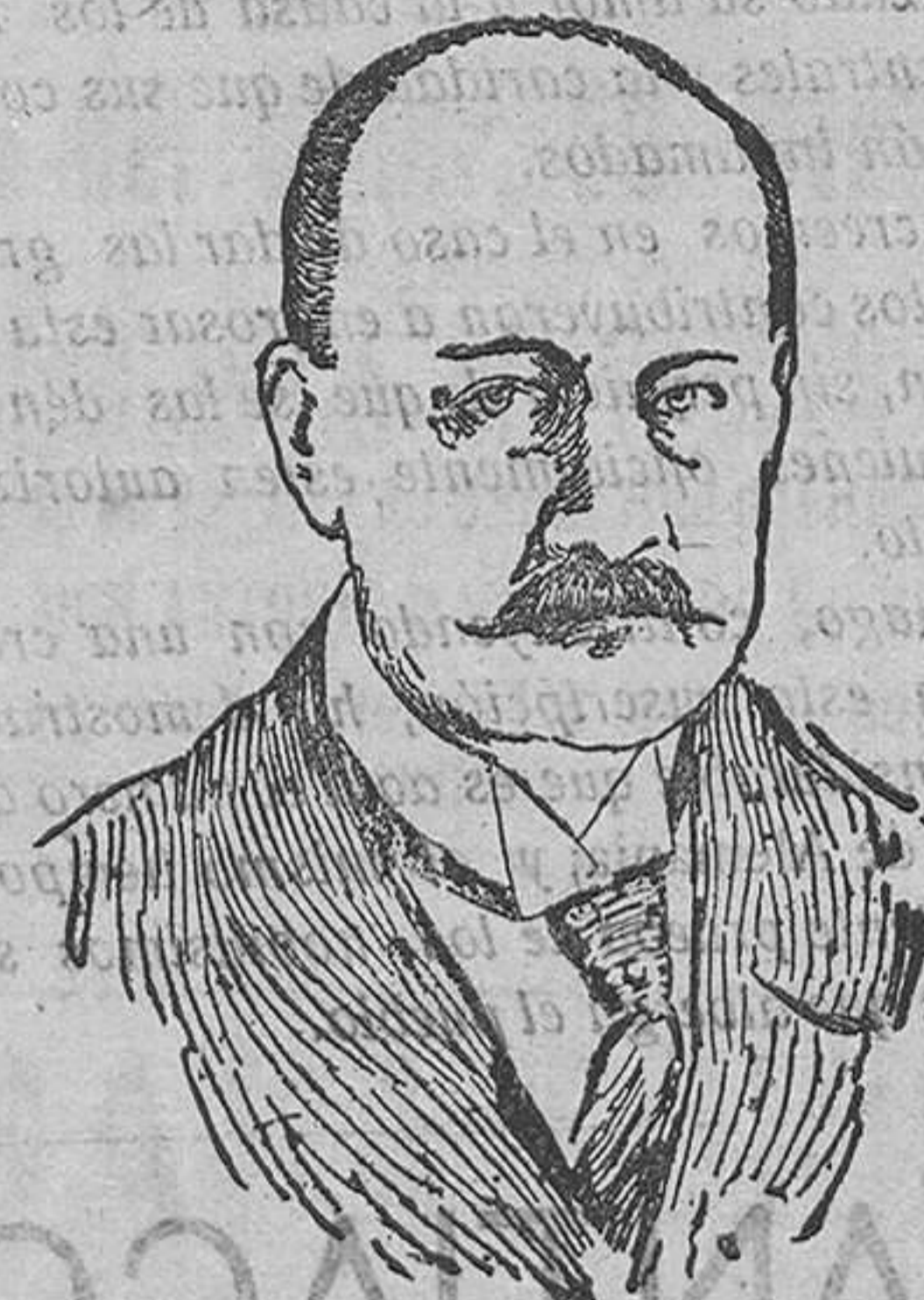
Von Den-Bussche, nuevo subsecretario de Estado de Negocios Extranjeros de Alemania.