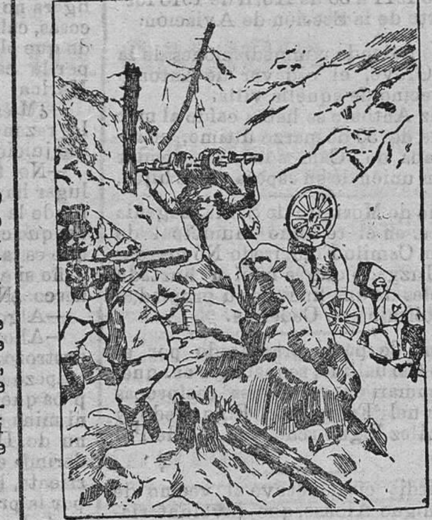
Alpinos italianos subiendo a brazo a escarpada posición piezas de artillería de montaña

Los beneficios que se desprenden de la libertad y de la paz los deseamos para nosotros mismos; pero también anhelamos disfruten de ellos los demás países.