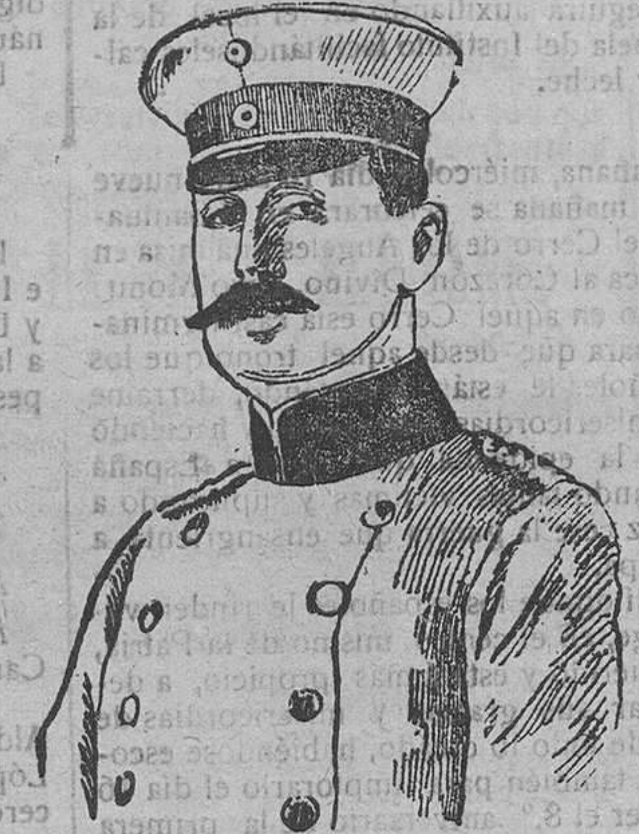
El príncipe Maximiliano de Baden, canciller alemán, que ha dirigido al Presidente Wilson la nota de proposición de paz.