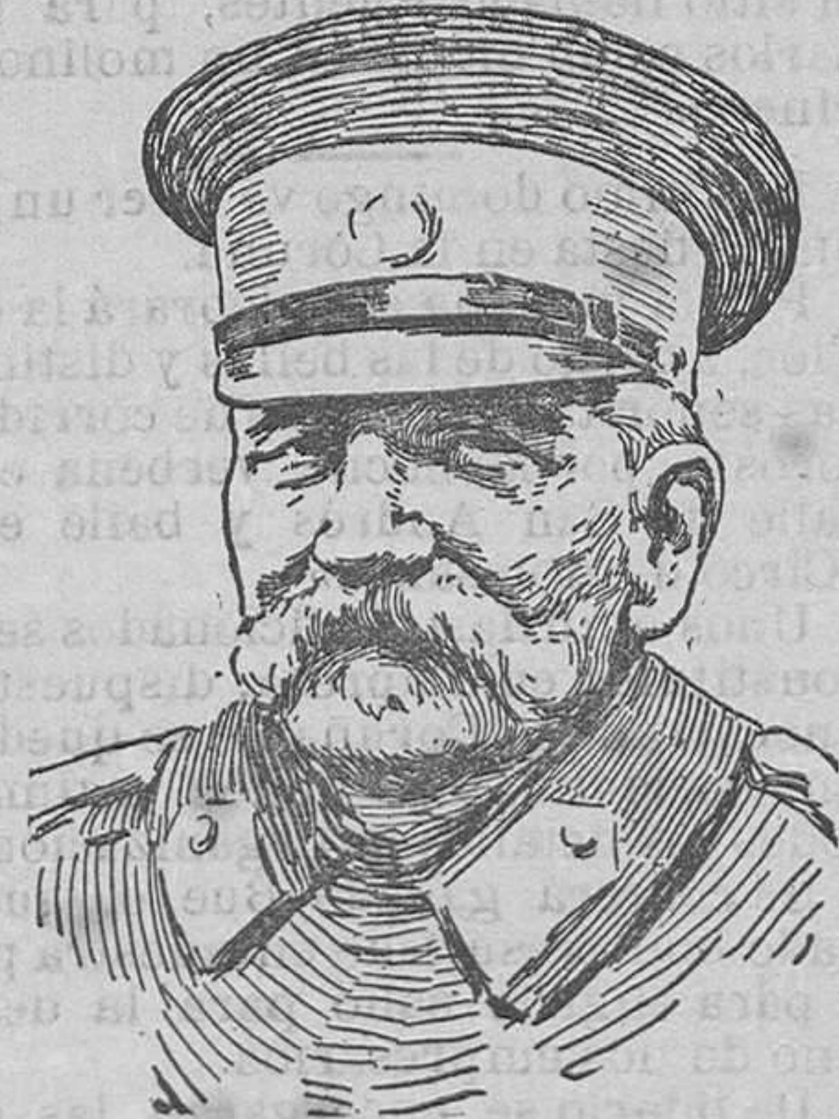
EL REY PEDRO DE SERVIA

Es curioso observar que haya dirigido la conquista de Novo Georgiewski el veterano general von Besseler, que fué el mismo que dirigió la de Amberes. El Kaiser, según refieren los telegramas, se ha apresurado a felicitarle. Esto demuestra la importancia que los alemanes adjudican a la toma de Novo-Georgiewski. Realmente, es el complemento que da efectividad a la de Varsovia.