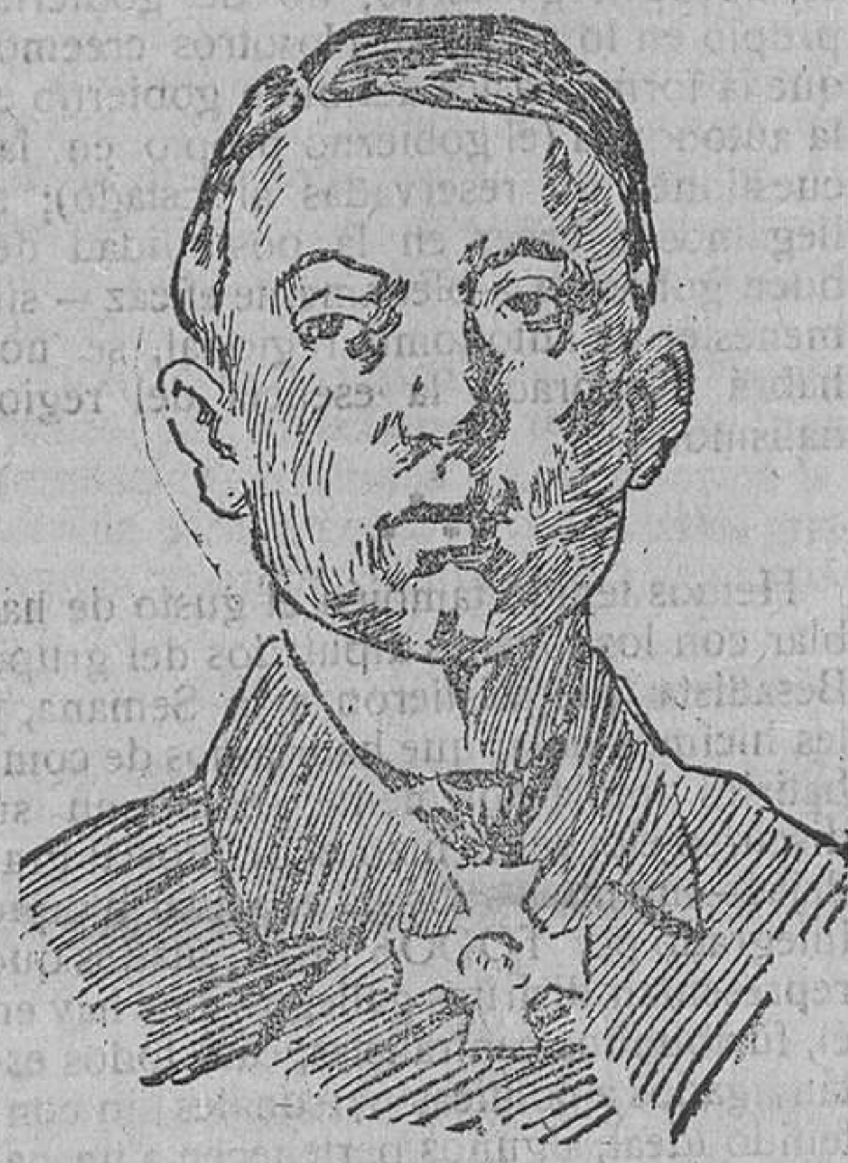
Von Hintze, que ha sustituido a von Kuhlmann en el ministerio de Negocios Extranjeros de Alemania.