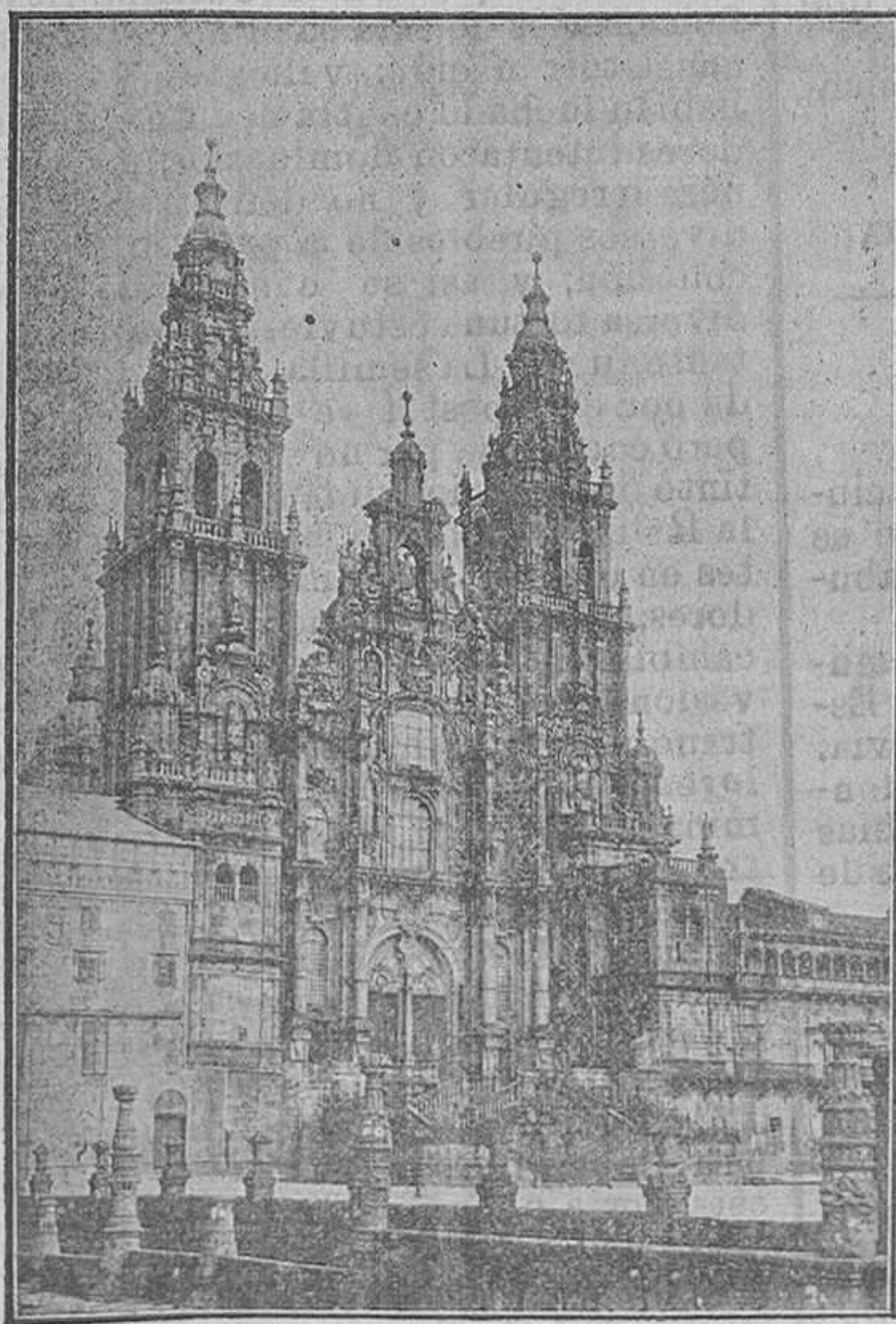
Catedral de Santiago. La fachada del Obradoiro

y la acata rendido y reverente con mudo espanto la creación entera. Habla el angustoso anciano con palabra divina desde el recio peñón del Vaticano y va de gente en gente la celestial doctrina por anchos valles y desnudas breñas explicando a los pueblos maravillas. Alzan alegres la abatida frente los pueblos conmovidos, y confiesan, hincando las rodillas: «Vicario del Señor, tu nos enseñas»