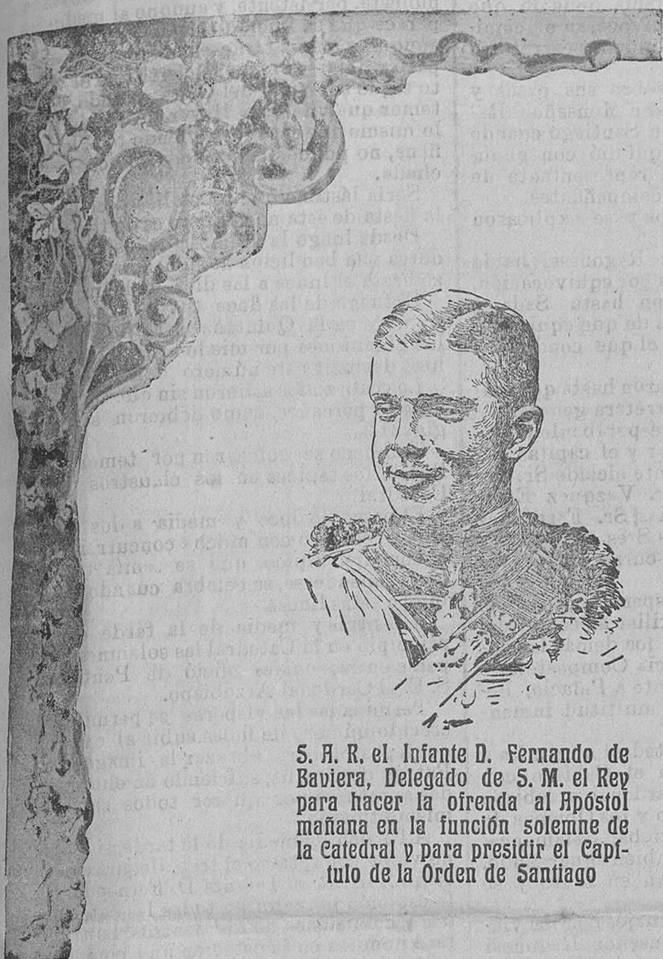
S. H. R. el Infante D. Fernando de Baviera, Delegado de S. M. el Rey para hacer la ofrenda al Apóstol mañana en la función solemne de la Catedral y para presidir el Capítulo de la Orden de Santiago

sucesos, que redimen de la vejez y de la muerte a las personas y a los pueblos, haciéndolos constantemente nuevos.