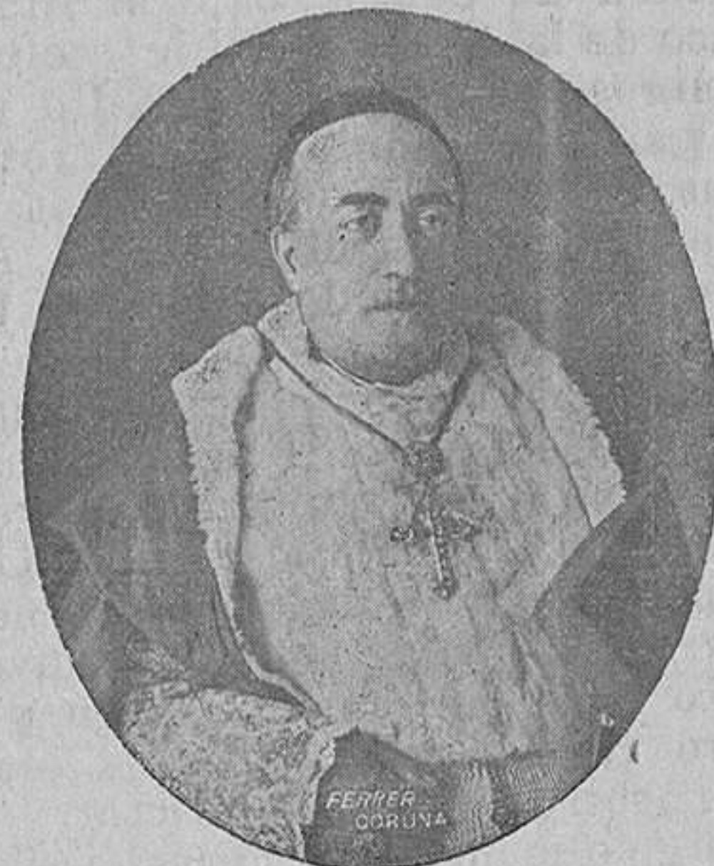
Emmo. y Revmo. Sr. Cardenal Martín de Herrera, Arzobispo de Santiago, que oficiará mañana de Pontifical en la solemne función y recibirá la ofrenda de manos de S. H. R. el Infante D. Fernando