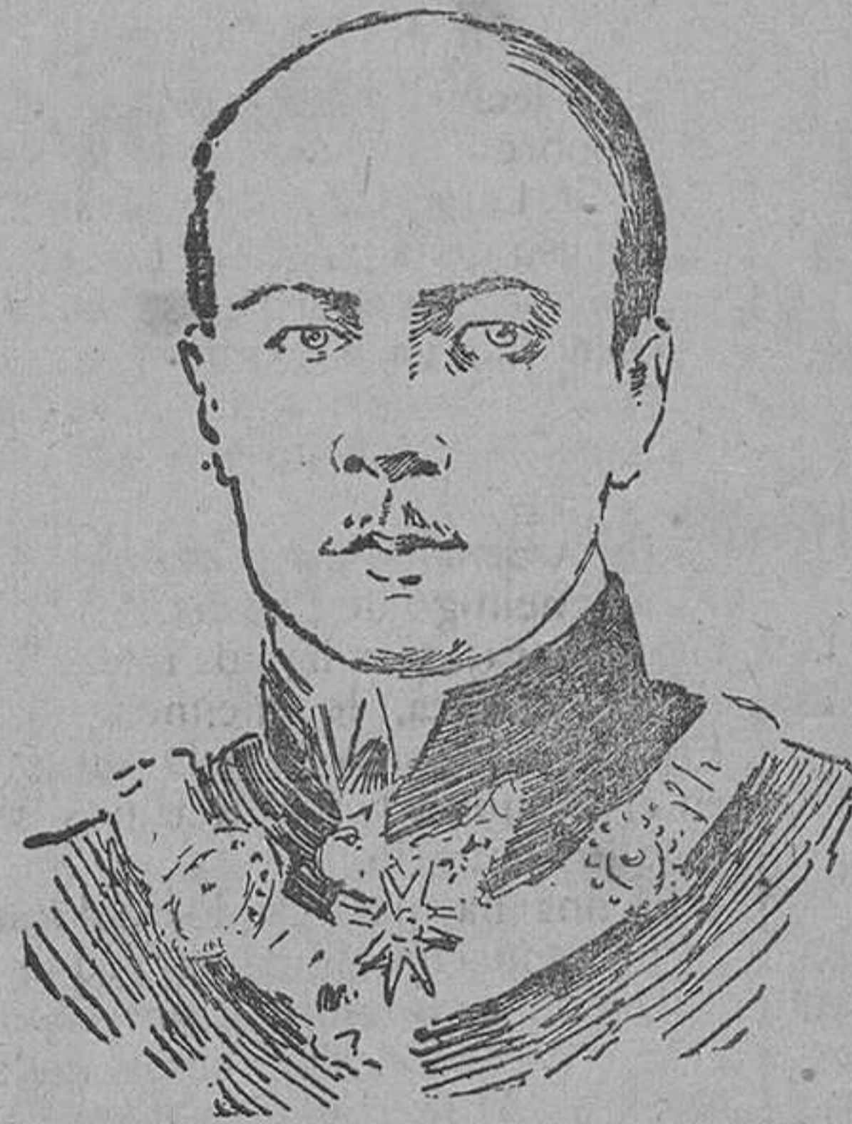
El conde Berehtold, que ha sido asesinado por un guarda de caza en Praga.