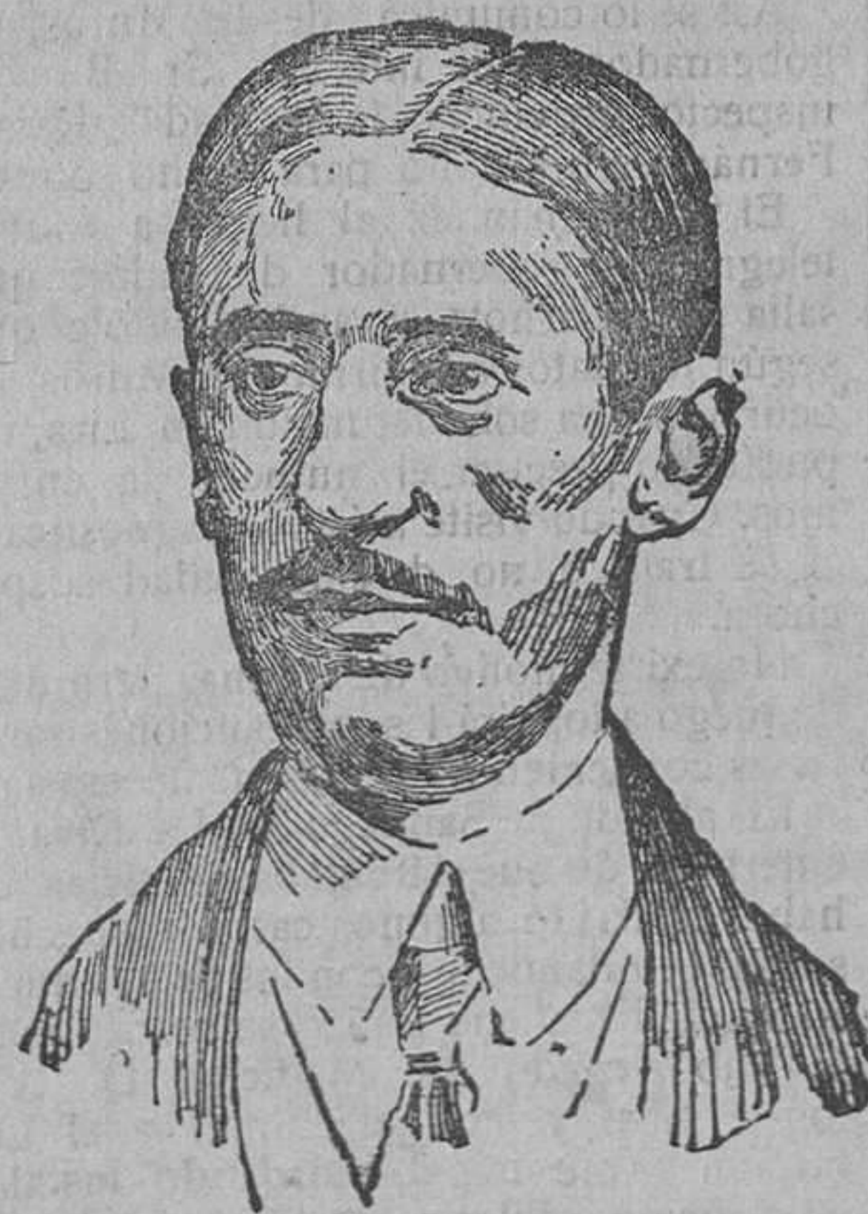
José María Usandizaga

Usandizaga nació el 31 de Marzo de 1887. Falleció el 3 de Octubre de 1915.