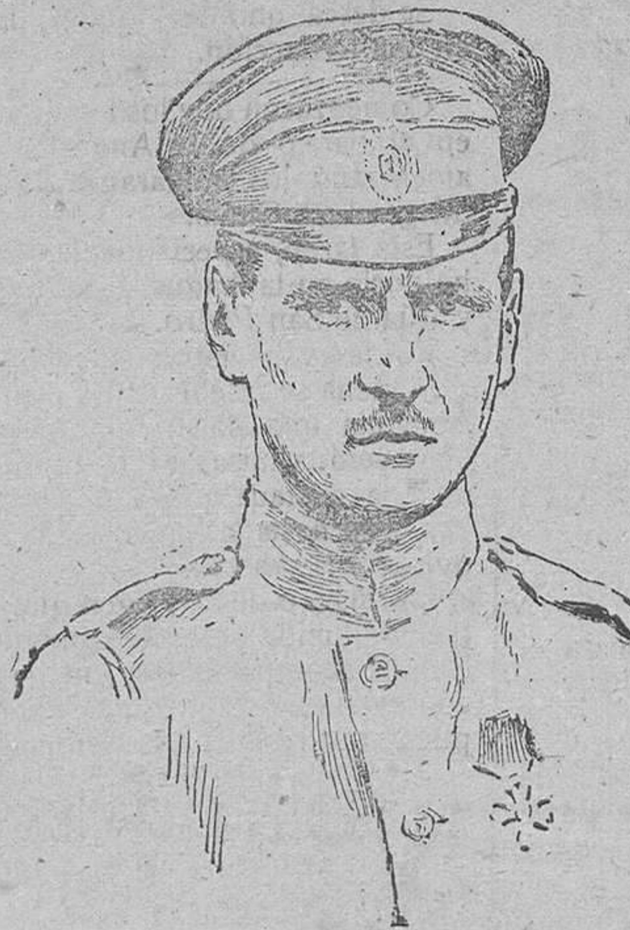
El gran duque Miguel hermano del Zar de Rusia; que por intentar la instauración de la Monarquía ha sido encarcelado.