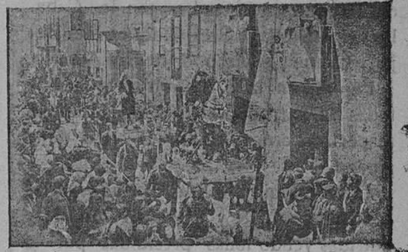
Procesión del Patronato.