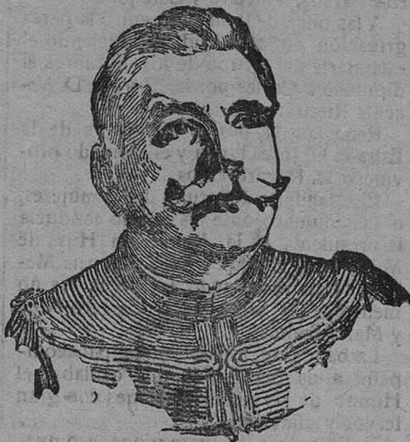
El Mariscal Joffre que se halla en Madrid siendo objeto de grandes agasajos y manifestaciones de simpatía.